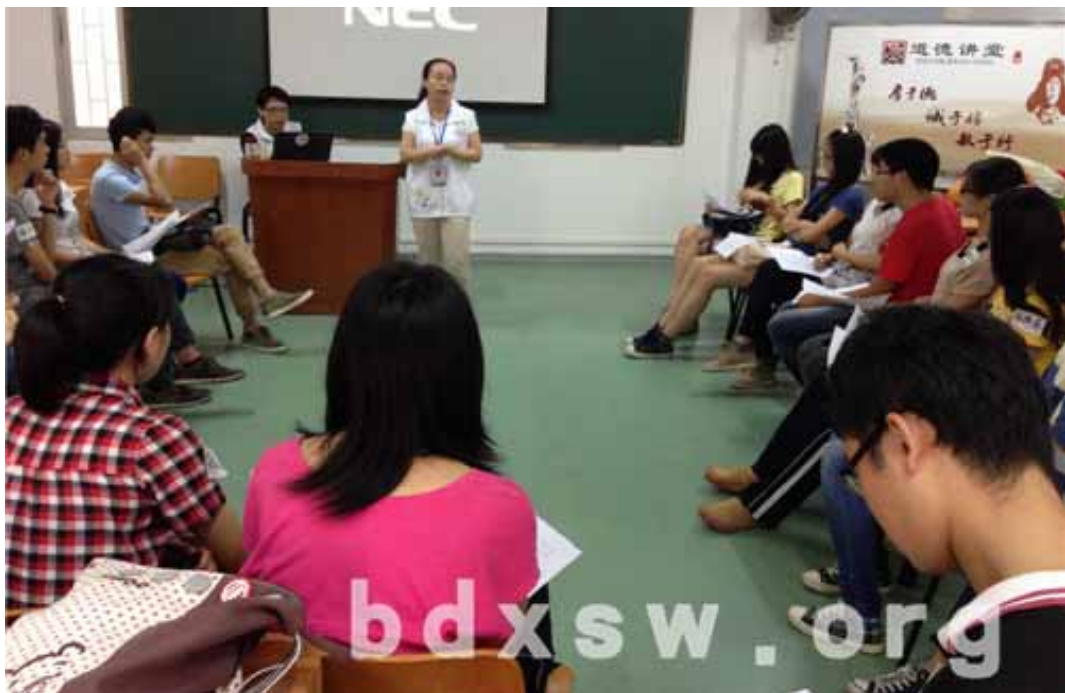
工作人员向义工讲解此次培训主要内容

培训结束后,义工们都满怀期待想要投入到探访服务中去,相信通过这次专业培训后,他们可以顺利完成此次探访。帮助更多有需要帮助的残康人士!