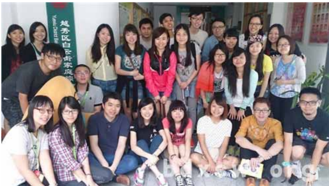
来访师生与白云街家综同工合影留念

本网讯（黄怡瑾）2014 年 5 月 24 日上午，香港城市大学社工系学生一行 24 人在其系老师的带领下来到广州市北斗星社会工作服务中心承接运营的越秀区白云街家庭综合服务中心进行参观和交流。