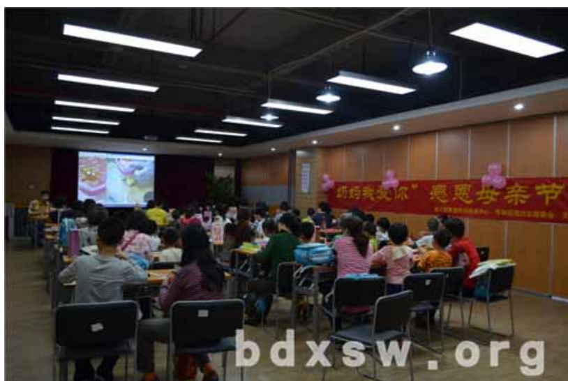
小朋友在老师的指导下精心为妈妈准备母亲节礼物

下课后,参与活动的孩子开心地带上母亲一起来到中心。活动一开始分成两部分,一部分是孩子们到配餐中心为母亲准备晚餐——亲手为妈妈包饺子,另一部分是母亲到书画室里开展茶话会。待饺子煮好后,母亲进场和孩子一同吃饺子,母亲们吃着孩子们亲手包的饺子,开心愉悦的表情溢于言表。本环节结束后,母亲和孩子一起进行母亲节礼物手工制作,本次活动邀请了专业的轻粘土教学老师莅临现场进行教学,孩子们在老师耐心详细的讲解下,认真的完成作品,遇到不会做的时候妈妈也会细心的给与帮助。母亲们看到和自己孩子合作完成的成品,脸上都洋溢着幸福快乐的笑容。