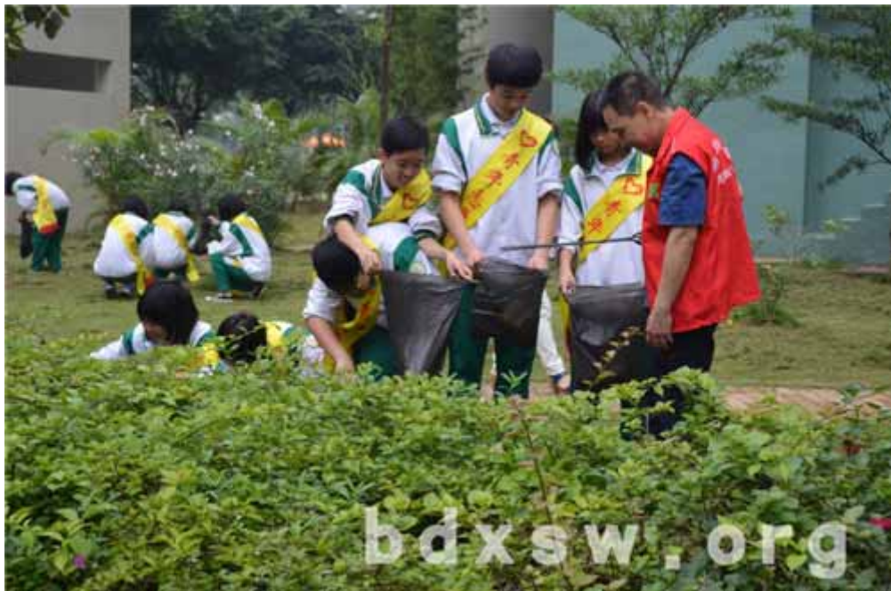
青年朋友清洁社区，合作无间

本网讯（吴杰臻）五四青年，服务社群。2014年5月4日下午4时，东濠街家庭综合服务中心联合荔湾区汾水中学、芳和花园社区居委会，以及怡康物业管理有限公司，在芳和花园共同举办了一场社区清洁活动。参与活动的青年朋友共70名，虽然分别来自不同的单位部门，但他们都是怀着同一颗心——服务社群。本次活动除了让辖区内的青年朋友有一个贡献自己力量服务社区的机会，同时也希望藉此活动倡导社区居民更多的关注社区内的环境卫生问题。