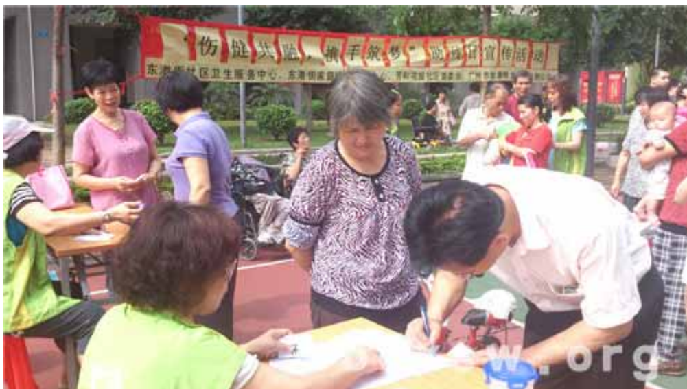
“伤健共融，携手筑梦”助残日宣传活动

本网讯(施雅)每年5月的第二个星期日是全国助残日，本年的主题是“关心帮助残疾人，实现美好中国梦”。东濠街家庭综合服务中心根据社区的需求和本年的主题，为东濠街的伤健人士和普通居民设计了一个“伤健共融，携手筑梦”的助残日宣传活动，希望通过本次活动，能够让社区的普通居民更加接纳伤健人士，而伤健人士可以更好地融入到社区生活之中。