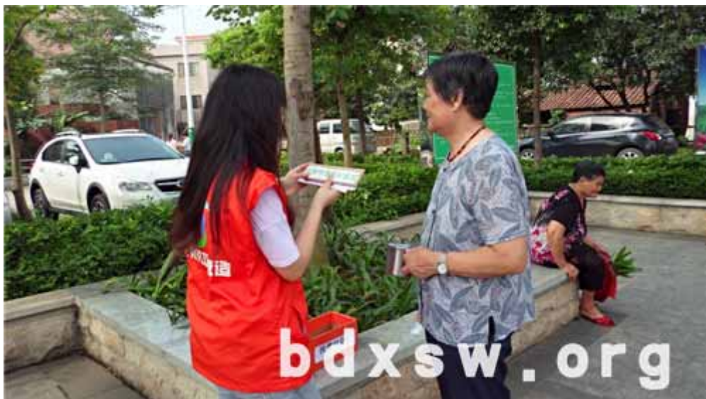
村民参与词句分类游戏

本网讯(石微)2014年5月19日上午,伦敦社区营造项目再次来到仕版村位阳开展第三期“我爱我家”环保宣传活动。