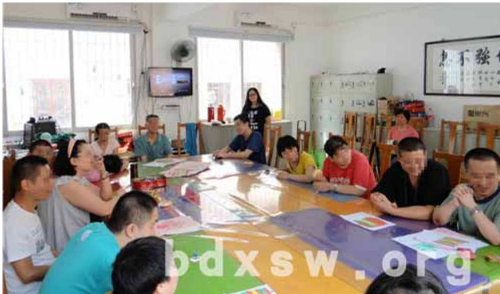
学员在玩“击鼓传香囊”

活动最后，工作人员端上提前煮好的粽子，让学员和家属一同品尝美味的粽子，分享端午的味道。活动不仅让大家感受到了中华传统文化的文化气息，也让每一位学员家属看到了学员在工疗站的变化与成长，提高了对学员在工疗站工作和康复的信心。