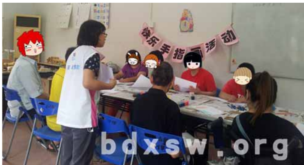
伤健人士认真听社工讲解如何创作手指画

活动结束后，伤健人士都很开心表示自由创作手指画，学会运用手指创作各种画，希望以后参与更多的社工活动。