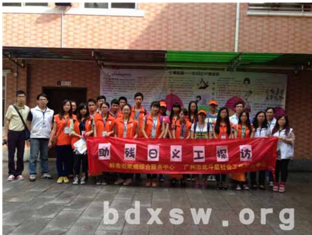
义工探访出发前合照

通过此次探访，残障人士从义工探访中得到了很大的情感支持，不少残康人士表示希望能有人上门探访他们。而活动结束后，义工也想社工反馈了很多好的建议。社工希望通过此类义工服务，让更多居民与社区内的残康人士互动，相互了解，促进社区共融。