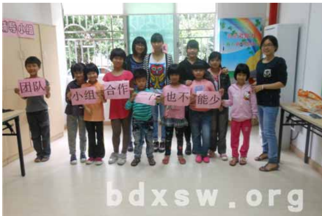
“一个也不能少”团队合作小组合照

在本次活动结束后，原来较为陌生的小朋友的关系拉近了不少，较为内向羞涩的小朋友也表现出一点点的活跃和兴奋。最后社工向小朋友预告了下次的活动内容，他们都表示会准时参加。