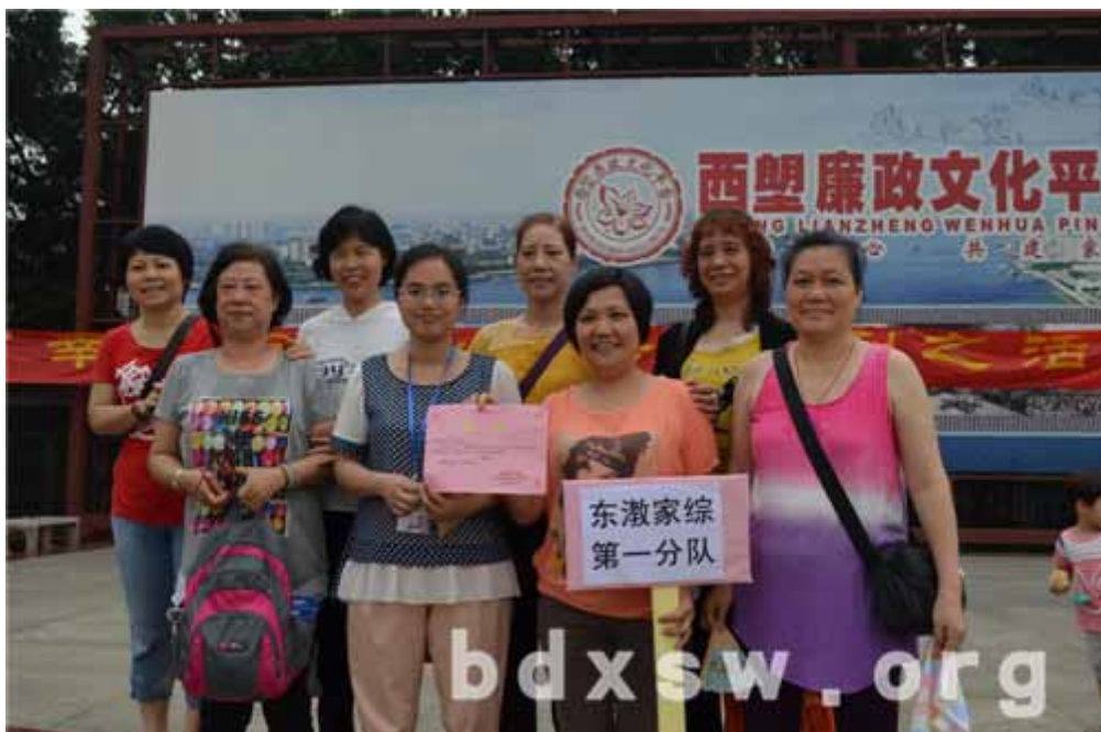
中心代表队勇夺第一

此次活动吸引了东濠街 5 个社区的居民一同参与，让他们在趣味十足的运动中收获乐趣与自信，也促进了不同社区居民的交往。中心也将继续深入社区开展适切服务，促进更多居民的社区参与。