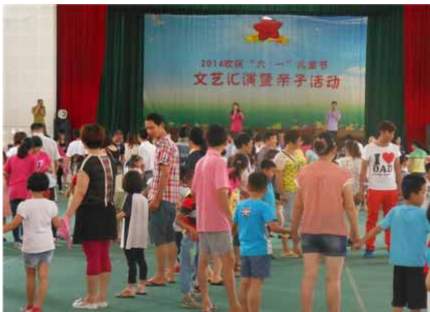
认真听游戏规则

活动结束后，部分亲子组员表达了自己的感受，部分家长表示“活动能够让孩子玩得开心的同时，也可以听听孩子的想法，平时很忙没留意那么多”，孩子更多是希望“以后多跟爸爸妈妈参加亲子活动一起玩”，活动在愉快的气氛中落下帷幕。