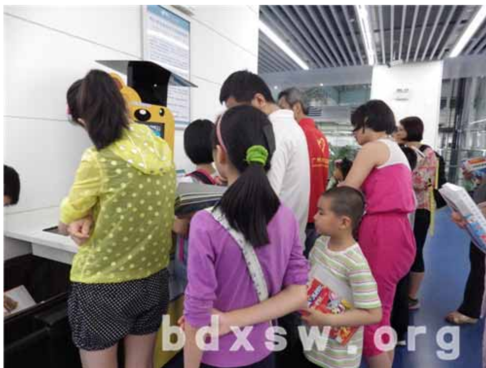
认真学借书

本小组吸引了四对新广州人亲子参与，旨在通过介绍广州惠民的公共文化设施，组织外出参观广州市图书馆，帮助新广州人了解及掌握获取广州市图书馆资源的方法与途径，更好地融入广州。同时外出参观为亲子互动、组员互动提供良好的平台，使新广州人能在亲情互动、组员互帮互助中共同探索、学习广州社区资源。