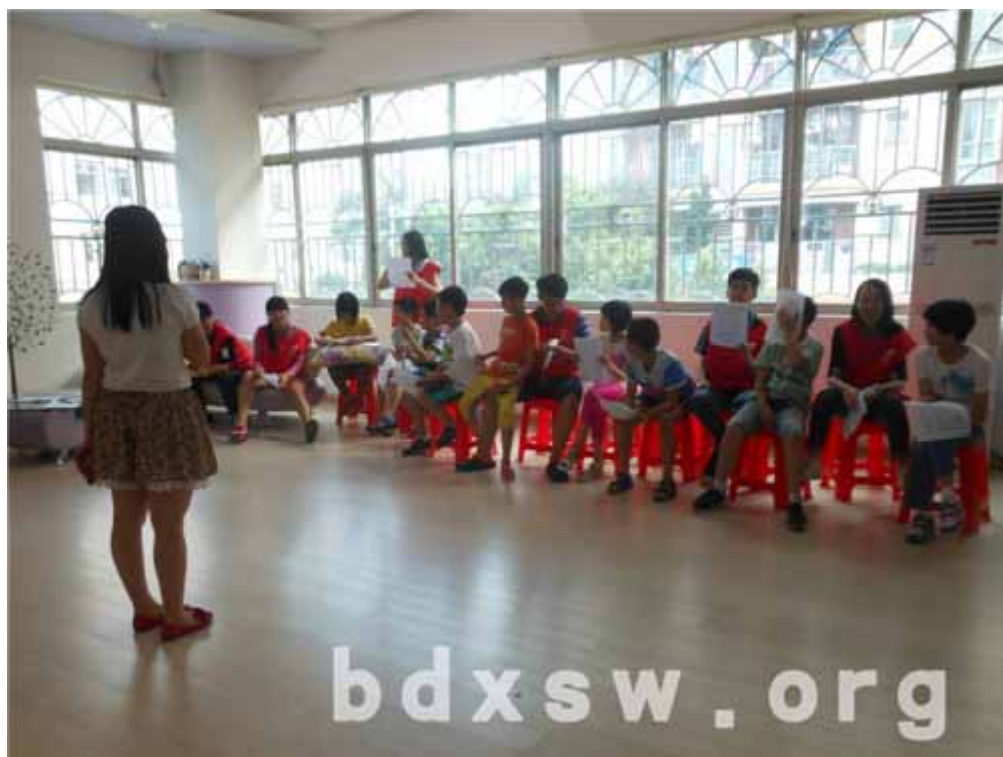
大家准备就绪进行故事演绎

本次活动共吸引了11名三到六年级的小朋友参加，由6名义工引导小朋友分组排练及演绎指鹿为马、小红帽等成语故事，旨在和小朋友建立良好的关系、激发小朋友的创造能力、提升其自信心。