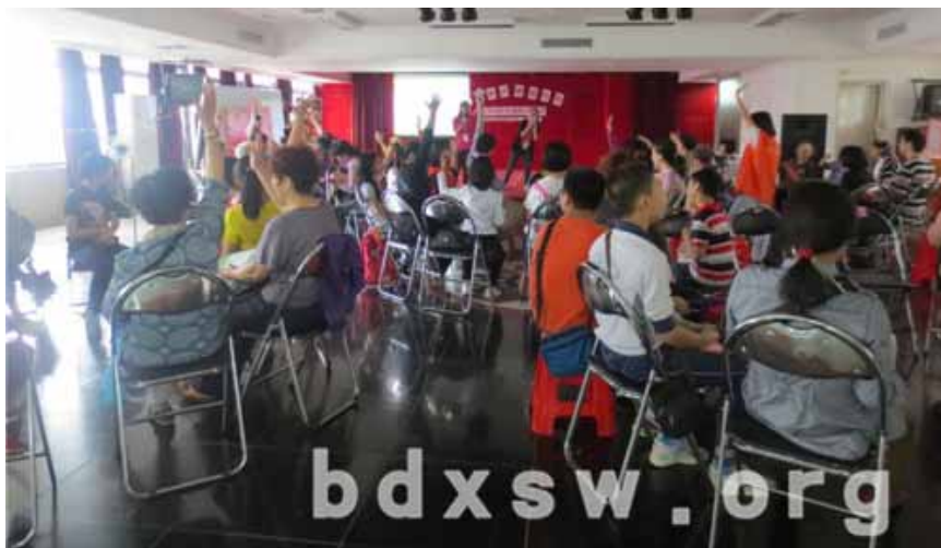
活动开始

本网讯（郑晓茵）2014年5月10日，“爱在身边，情系白云--第三期会员日暨母亲节活动”顺利举行。白云街家庭综合服务中心邀请了青少年、家庭、长者、残康各领域的会员参加本次活动，旨在为各会员提供一个表达对母亲的爱与感谢的平台，同时促进长、残、青与家长的相识与共融。