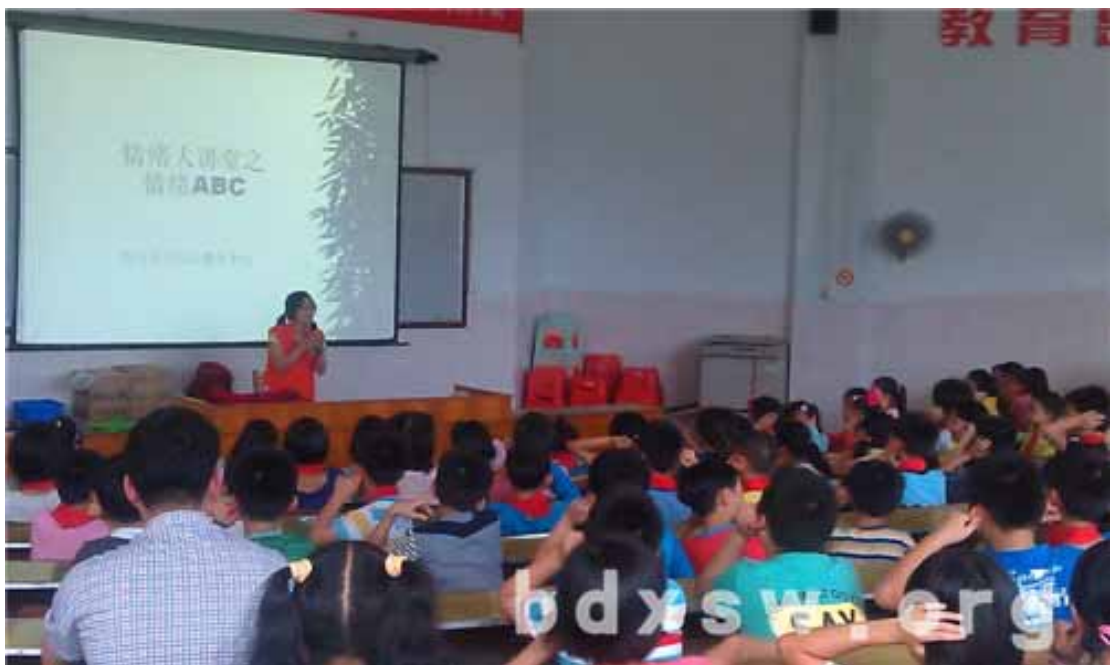
情绪大课堂之情绪 ABC

在简单总结同学的回答并指出情绪是什么之后，社工就同学刚才提到的“开心、快乐、痛苦”等进行了归类，并让他们了解情绪没有好坏之分。最后社工以“情绪串串连”的游戏让同学们体会情绪的表达，识别不同的情绪。