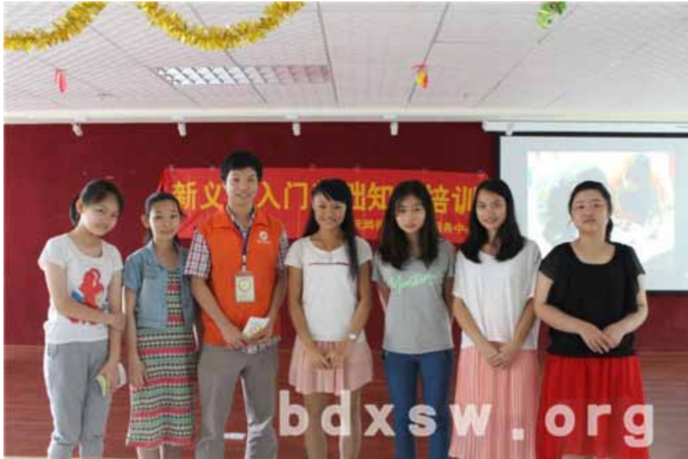
义工培训合照

之后培训中，社工还介绍了中心的义工服务范围及义工风采展示，使义工学员能更直观的了解义工们所提供的服务内容。另一方面则通过介绍中心的义工激励制度，鼓励义工们通过积极的表现，来获取中心对于义工的嘉奖。最后，向每位学员派发《义工手册》，欢迎每一位义工成员的加入，作为中心义工的象征，义工们每次服务后必须由社工在《义工手册》上将服务记录进行登记，是参与元岗家综各种评优活动的重要依据。