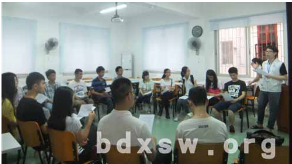
义工在认真的听社工讲解探访资料的填写

训主要是让义工对探访的活动内容有一个基本的了解,同时学会怎样在探访中与残康人士进行沟通交流。