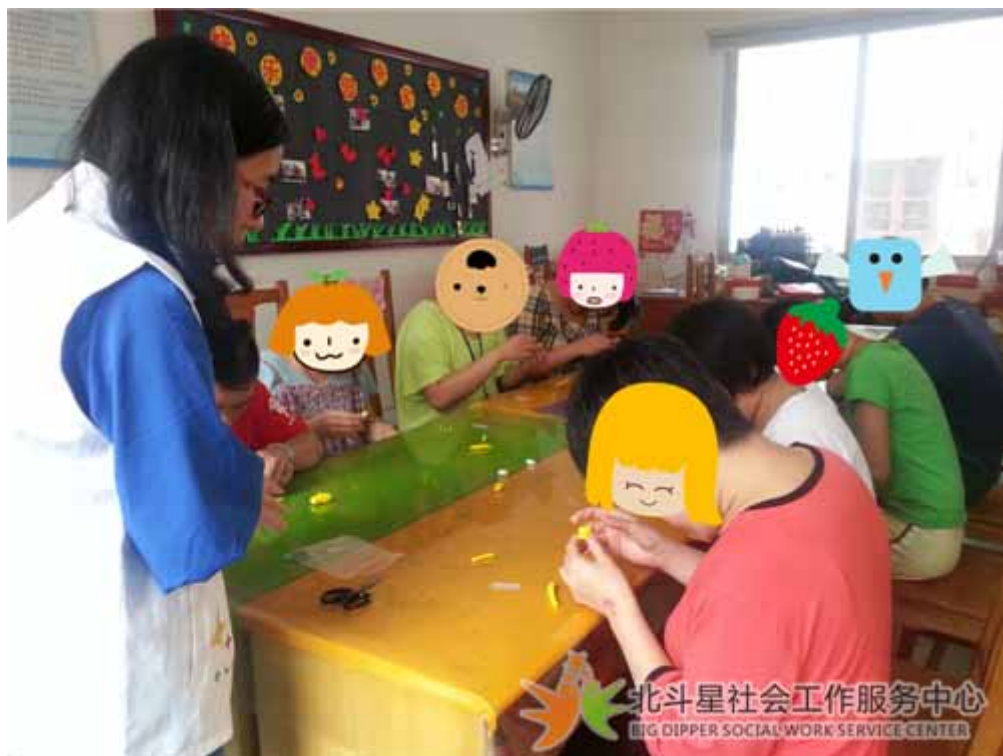
组员认真制作“玉米”