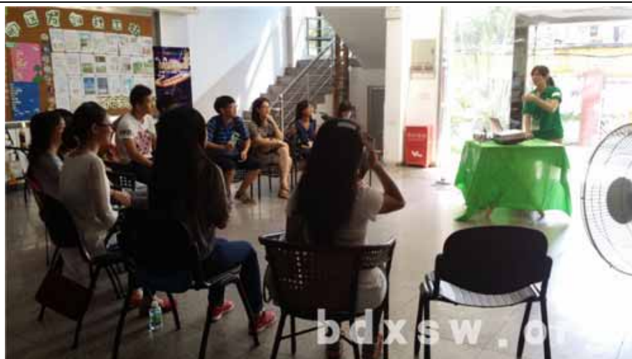
负责社工向义工介绍友邻社工站的义工服务

活动随着热身游戏“击鼓传花”拉开序幕，每个接到花球的义工都很幽默风趣地作自我介绍，使现场气氛瞬间热闹了起来。接着，友邻的负责社工把全体义工分成4组，每组均包含友邻和均安义工，4组分别围圈而坐，让组内成员互相自我认识。组员间彼此认识后，社工让每组成员抽取各自的任务信封，并在规定时间内完成任务。很快地组员间马上研究信封里的任务内容并出发执行，大家要执行的任务包括在友邻社工站里找到人口信息及小组居民信息、义工活动照片包、找出华盖地图上的四个特色地点并出发该地进行合照等等。转眼间大家都开始跑上跑下地忙起来了，有些组很快地就找到了信息表，但是有些组来来去去都找不到，最让社工哭笑不得的是有些组明明已经到达照片包摆放的地方，但是看了两眼就走开了。30分钟过去了，一个一个组陆续地完成任务回来了，完成任务后的大家额外兴奋。最后，负责社工让大家分享各自组内的任务成果，并向大家介绍了友邻社工站的义工服务情况，大家都听得津津有味。