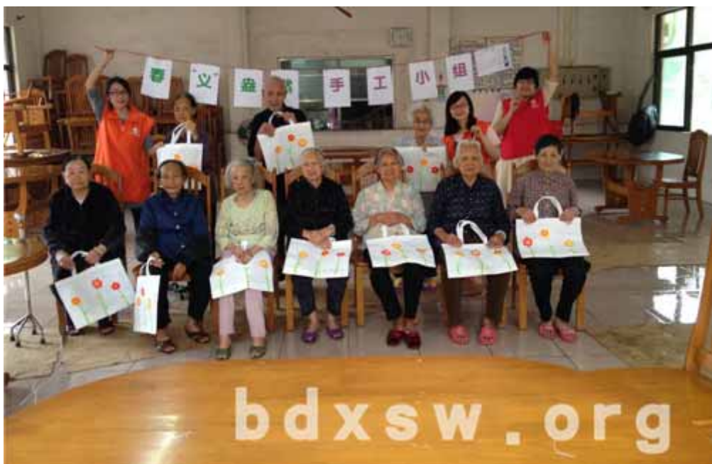
带上作品来张大合照

活动在集体合影后结束，长者们满意的笑容让义工和我们感到一切的付出都是值得的，期待下次活动的开展！