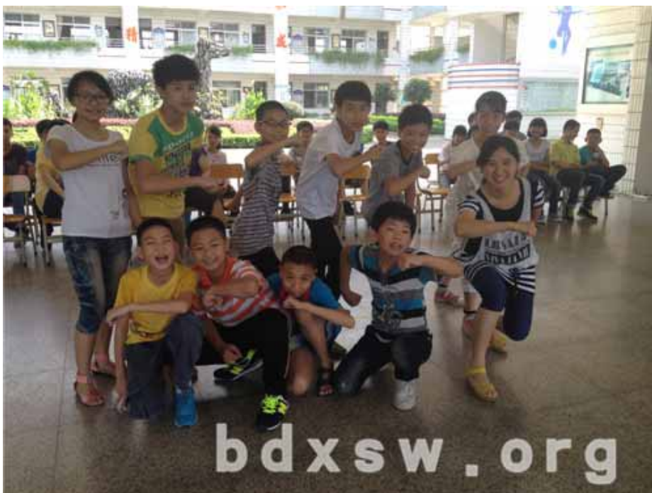
“我们是胜利小组！”

本次活动在上午10点，在星槎小学一楼大厅准时开始。首先，社工向各位同学表达了节日的祝福，并进行了简单的自我介绍；之后，社工开始第一个环节：坐地起立活动。每个班级抽出10名同学，在了解到示范同学的动作要领之后，各个班级的小队在老师的协助下，进行最简单的2人，到4人，6人，一直到10人的坐地起立练习，参与的同学一起协商，如何进行起立，并一起喊号子来规范自己队伍的情况。在各个小队都熟练掌握之后，社工协调4个小队进行比赛，激发学生的参与热情，现场一片加油声和呐喊声。