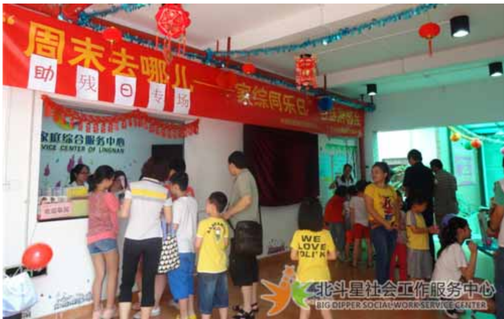
助残日活动现场

本网讯（徐镒婵）为了使社区居民更了解残康人士，进一步加强社区居民之间的交流，岭南街家庭综合服务中心 5 月 24 日中心操场为社区居民开展“家综同乐日”之助残日专场活动，使社区居民透过摊位游戏对残康人士的生活况有更多的了解，拉近居民与残康人士之间的距离。