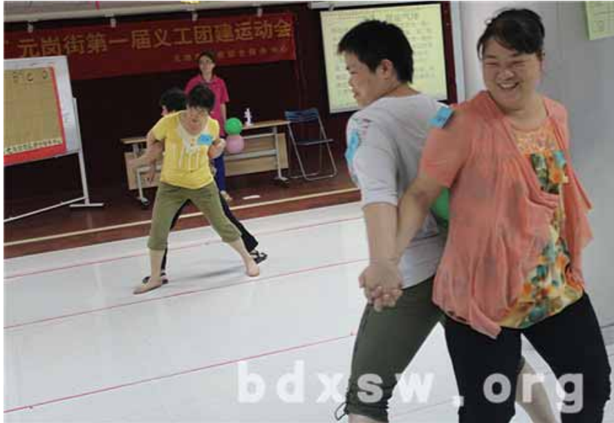
精彩激烈的背运气球项目

本次义工运动会旨在增加义工团队对中心的归属感，进一步宣传“奉献、友爱、互助、进步”的义工精神，提供平台展示元岗家综义工风采，加强义工身体素质和加深义工团队之间的交流学习。