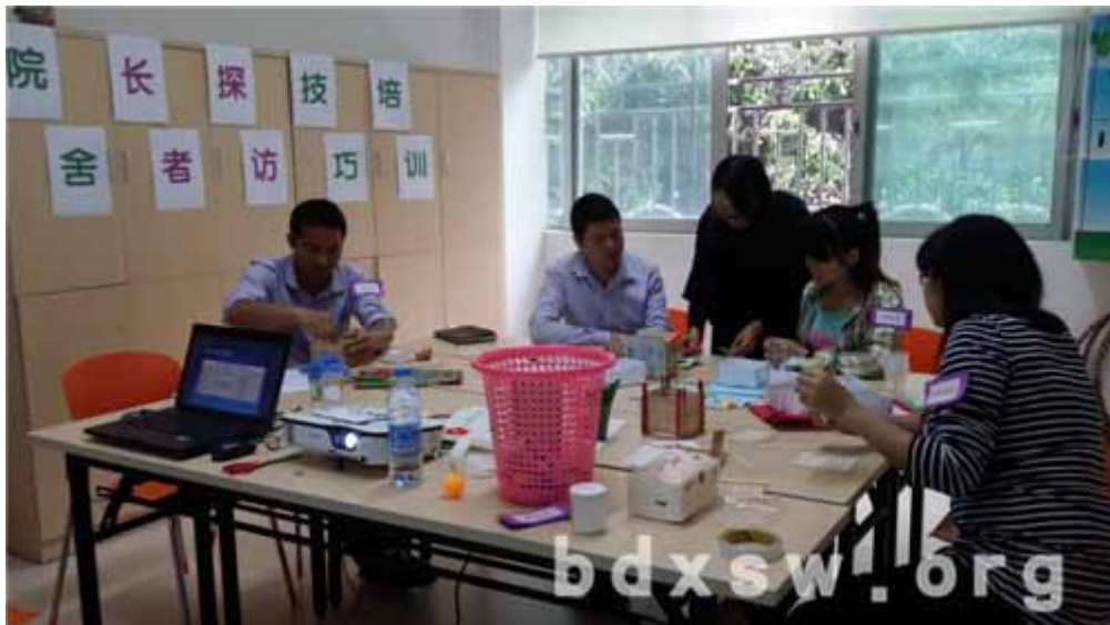
义工练习制作手工

本网讯（欧阳焕结）2014年5月8日上午，均安社综开展院舍长者探访技巧义工培训，共4位自由职业或在职义工参加，培训主要介绍院舍长者探访的技巧及即将开展的长者手工小组各项手工制作要领。