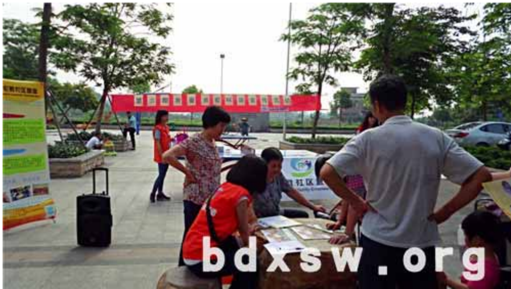
村民参与拼图游戏（拍摄 严嘉铭）社区营造

活动分为 5 个小摊位，分别是兑奖、宣传、仕版牌坊拼图游戏、手指画绿树、生活点滴环保词句分类。本期活动的拼图图片选用的仕版牌坊，并印有“爱护仕版、人人有责”几个大字，让村民意识到爱护仕版就是爱护自己生活的家园，活动中也有村民一边拼一边将标语念出来，很快就将拼图拼好了；手指画绿树游戏是让村民用手指在干枯的树枝图片上“画”满绿色树叶，活动用意是想让村民意识到建设美丽家园需要大家的共同参与；词语分类游戏的主题是“我已经做到的”和“我要做到的”，一方面可以借这个游戏了解村民日常生活的中的环保意识程度，另一方面也能让村民回忆自己日常的行为习惯是否环保。小小的游戏，满满的心意，每个活动摊位社工都是以聊天的方式同村民打开话题，不仅向村民介绍社区营造项目内容，还收集到了一些村民信息，有效增加了社工同村民之间的熟识度。