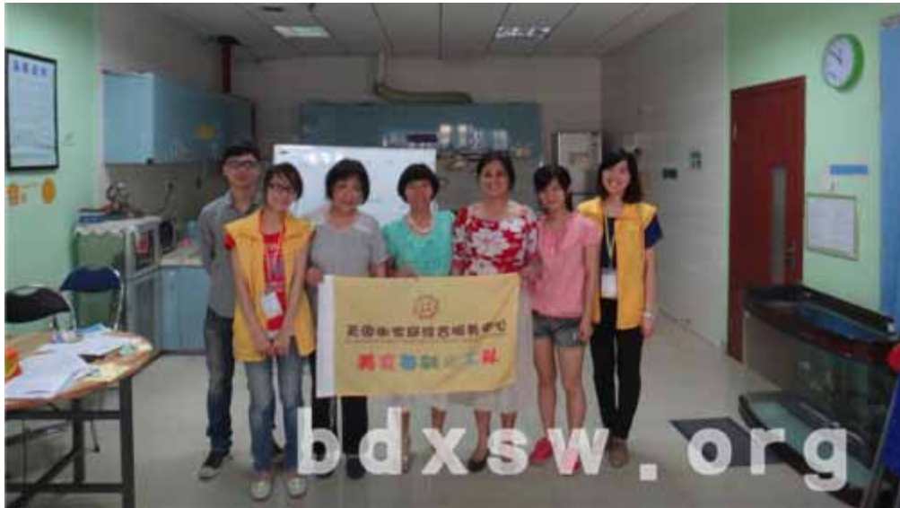
义起美食交流会活动的全体参与人员的合照

然后到了推荐队长环节，队员马上推荐王阿姨和另一个周阿姨当队长与副队长一职。两位阿姨表示非常开心能加入到美食每刻义工的队伍当中来。