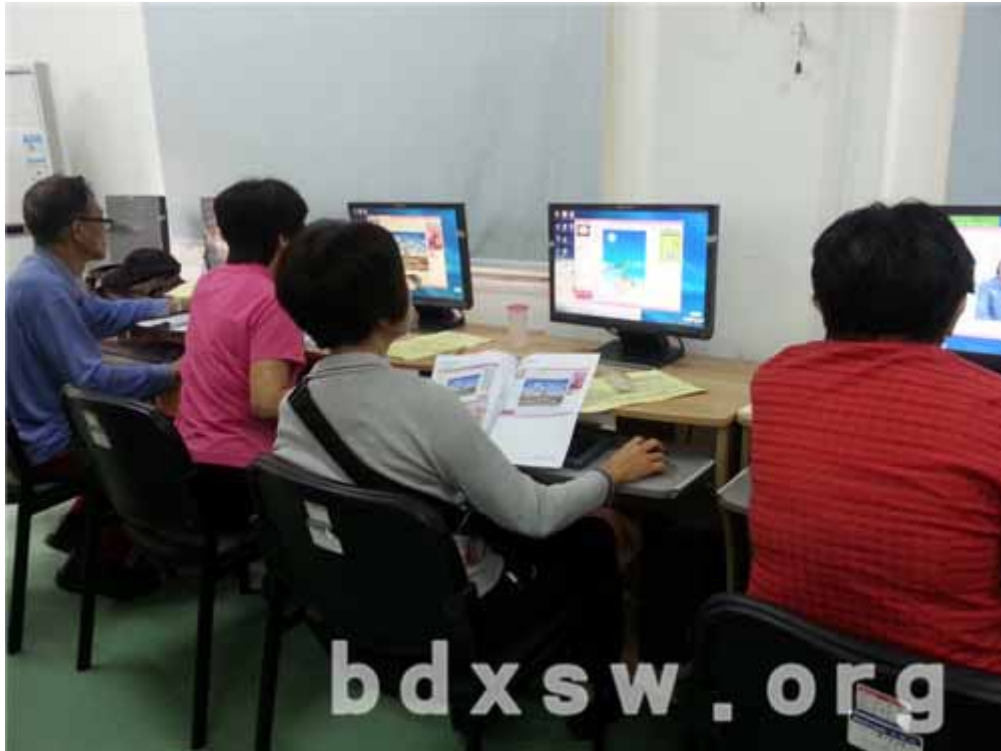
组员上机操作中

刚开始由于组员之间相互不熟悉，小组的气氛并不是很热络。但经历自我介绍和暖场游戏之后组员之间变得熟悉，慢慢地组员之间的交流增多了。小组过程中组员们都非常积极踊跃，并在学习过程中互相帮助，尤其是一些学习进度较快的组员会给基础较为薄弱的组员示范，全程都沉浸在快乐轻松的气氛中。组员们通过五节小组学会了美图秀秀“美化”“画笔”“拼图”等操作方法并且每个组员都有自己的作品。组员之间也建立了“同窗情谊”，相互之间共同学习、互相帮助、共同成长。