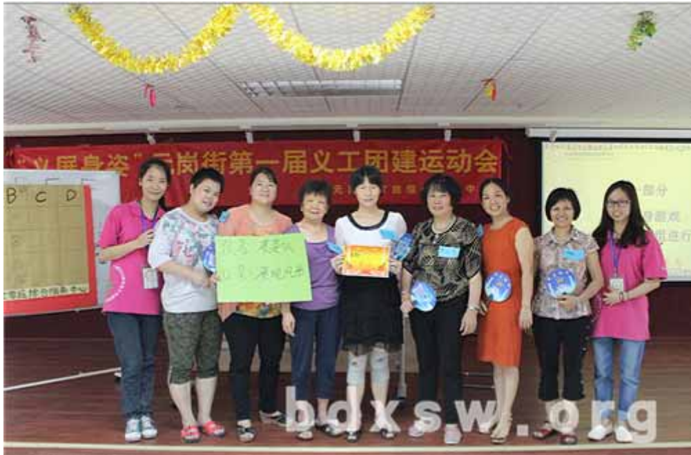
获奖小团队合影留念

义工们通过本次运动会展现出了义工的风采，赛出了义工的气势，增进了义工们的友谊，伴随着一片欢笑声中，元岗家综第一届义工团建运动会也划上了圆满的句号。参与义工均表示礼品不重要，更重要的是活动能令义工感受到义工团队的快乐，在这里能够认识更多同样热心的义工朋友们。在互动当中，他们能体会到义工不仅仅只是付出，自己也能收获很多，如友情、快乐。期待下一次义工的盛会，在义工服务之余，收获更多的友情与快乐！