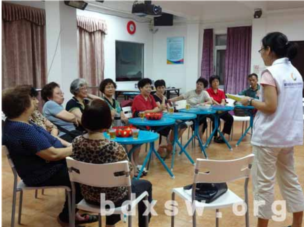
组员分享参加电脑小组的经历

这批同质性的长者集合起来做一个交流，分享在学习电脑过程中的趣事、收获，同时也藉此机会收集长者对电脑小组的意见和建议，以及在日常使用电脑中遇到的难点，由长者和社工共同编撰一本电脑操作技巧小册子。