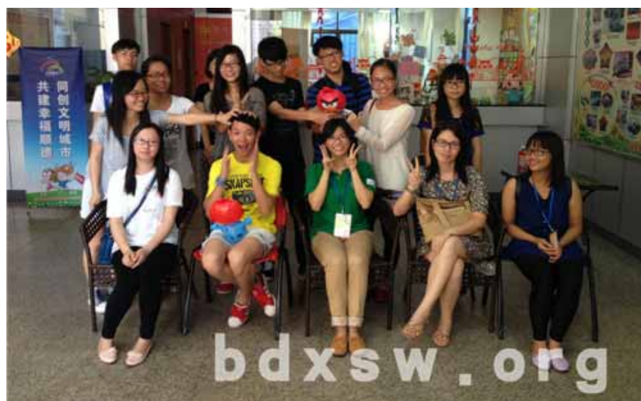
活动结束后大合照

活动随着热身游戏“击鼓传花”拉开序幕，每个接到花球的义工都很幽默风趣地作自我介绍，使现场气氛瞬间热闹了起来。接着，友邻的负责社工把全体义工分成4组，每组均包含友邻和均安义工，4组分别围圈而坐，让组内成员互相自我认识。组员间彼此认识后，社工让每组成员抽取各自的任务信封，并在规定时间内完成任务。很快地组员间马上研究信封里的任务内容并出发执行，大家要执行的任务包括在友邻社工站里找到人口信息及小组居民信息、义工活动照片包、找出华盖地图上的四个特色地点并出发该地进行合照等等。转眼间大家都开始跑上跑下地忙起来了，有些组很快地就找到了信息表，但是有些组来来去去都找不到，最让社工哭笑不得的是有些组明明已经到达照片包摆放的地方，但是看了两眼就走开了。30分钟过去了，一个一个组陆续地完成任务回来了，完成任务后的大家额外兴奋。最后，负责社工让大家分享各自组内的任务成果，并向大家介绍了友邻社工站的义工服务情况，大家都听得津津有味。