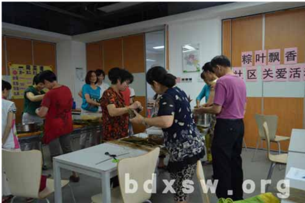
义工一起包粽子

中心社工每个月将会组织义工进行一次上门探访活动，促进社区居民间的活动，同时能及时了解到居民的需求。