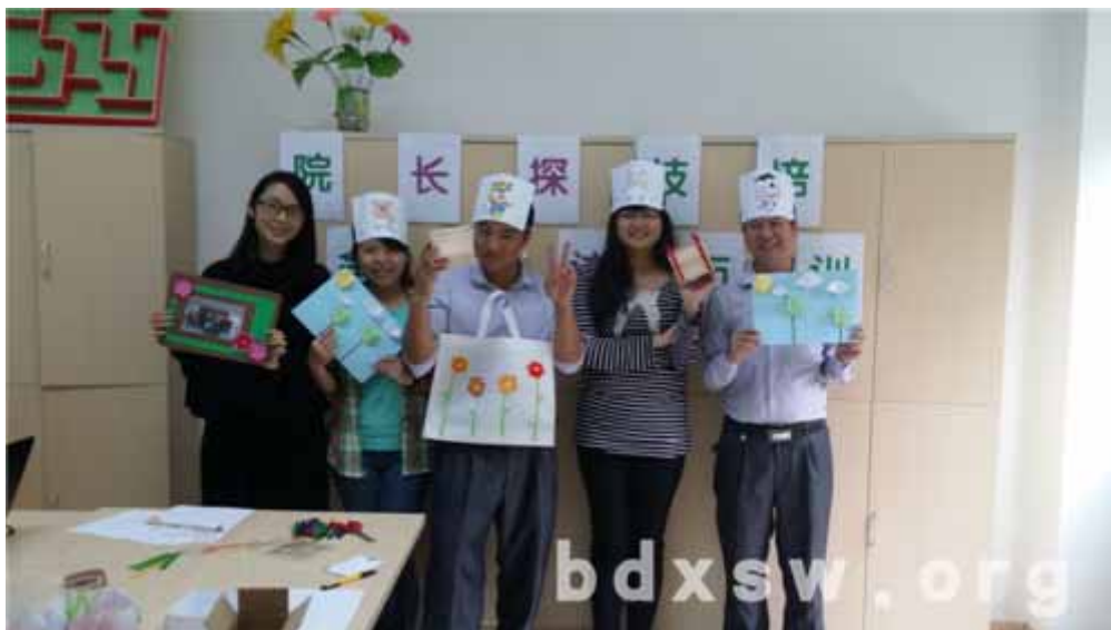
义工满意地展示手工作品

活动在大家乐此不疲的讨论中结束，义工有热情让社工仿佛看到小组的顺利开展情形，感恩有着这些无私奉献的朋友一直支持着我们！