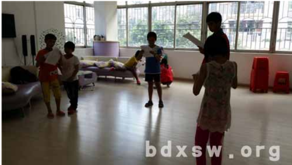
排练期间小朋友们都非常配合义工

通过两期的开展情况，“小小故事家”儿童故事编导活动得到了大部分家长与小朋友的支持与肯定，不少小朋友表示活动很有趣并且认识了很多朋友仔，希望以后能多点参加这类型活动，另外义工们表示这一期比上一期活动有经验了，在带领小朋友排练和演绎时相对轻松了一点。