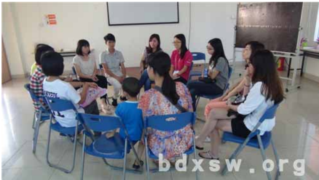
活动后分享

人与人之间的距离，只是一个微愿望的距离。2014 年，让我们一起去创造这样一个机会，让伤健群体能够在同一蓝天下，温暖手牵手！