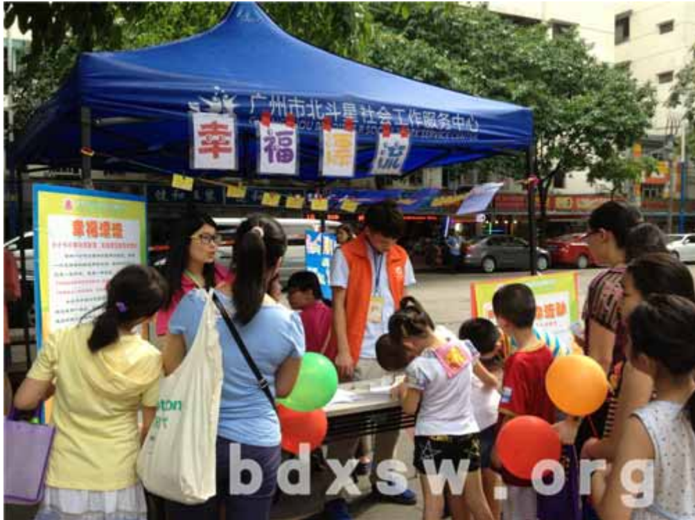
“幸福漂流”摊位

本次游园活动，共设有“幸福漂流”、“球球是道”、“创意气球”、“社区知多少”、“端午文化知多少”、“飞机投篮”、“快乐涂鸦”及暑期活动宣传摊位 8 个摊位。参加者可在签到处签到并领取“集印卡”就可参加各个摊位游戏，集满 4 个或以上印花就可换取精美小礼品。本次活动一共有 13 位义工协助开展活动，有 8 位是青义社的成员，有 5 位是小喇叭宣传义工队的成员。“幸福漂流”摊位是参与者填写邻里互助卡，可以写上自己可以帮助别人做什么或者需要什么帮忙的，社工会根据相应的内容进行互助配对。”球球是道“摊位是合作传球的游戏，参与者要与一个同伴一起完成。”社区知多少“是在社区地图上标注自己住的位置和在卡片上写上认为社区需要增加的设施。”端午文化知多少“是参加者先看社工准备的端午文化知识，然后通过问答来考察参与者对端午文化认识多少。“快乐涂鸦”是参与者可在画布上以“儿童节”为主题任意涂鸦。在活动当中，小喇叭义工队的组员还带领大家一起跳舞。活动用青少年的活力带动社区的活力，围观的大人们也忍不住一起参加摊位的游戏。