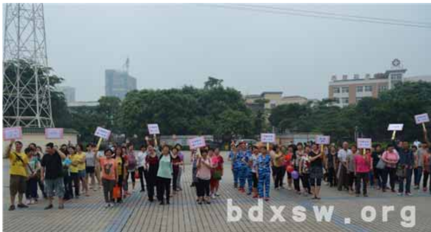
参赛队伍风采展示

本网讯（吴烈雄）5月20日上午，西塍文化活动中心广场热闹非凡，由东濠街家庭综合服务中心与西塍居委会合作举办的“幸福东濠社区秀”系列之西塍趣味运动会在此顺利开展，100多名来自不同社区的东濠街居民参与了本次活动。