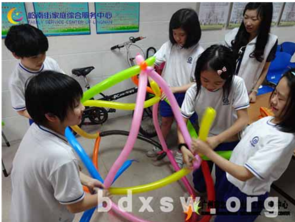
青少年合力制作气球小屋

在最后一节小组中，组员齐心协力，打造一个气球屋，完工的一刻。组员均兴奋雀跃，这是彼此共同努力的劳动成果。有组员更是表示，希望日后能够有机会继续参加中心的活动，在学习到有趣的知识之余，同时亦可认识到更多新的朋友。