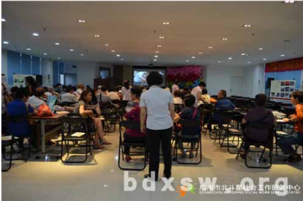
长者们参与养生保健座谈会

通过宝生园一日游活动，长者们不仅体验到了出游的乐趣，更在活动中认识了新的朋友，增强了长者在社区中的人际交往圈子网络。