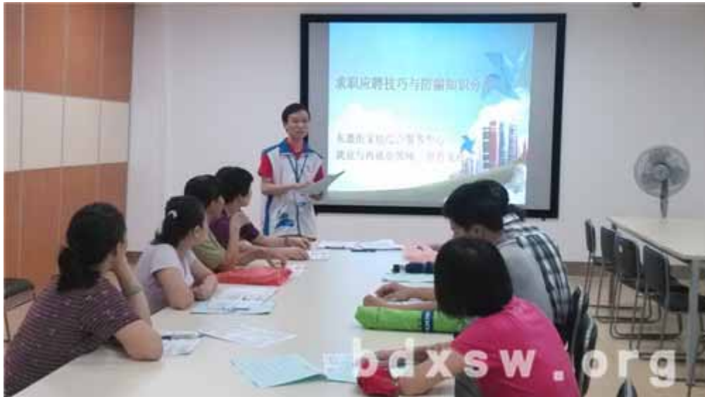
居民在认真听讲座

了居民对这三个概念的理解。然后社工分别讲解了就业服务的内容以及就业个案服务申请的流程，不少失业人员都表示有就业服务的需求。随后，社工由求职路上遇到的各种困难讲起，慢慢的讲到大家在求职路上遇到的各种陷阱，并通过 ppt 展示了 8 个实际案例，详细的阐述了骗子的各种手法以及应对的防骗“秘籍”，在讨论环节中，居民都纷纷说出了自己的体会，并向社工体提了不少问题，活动氛围十分融洽。