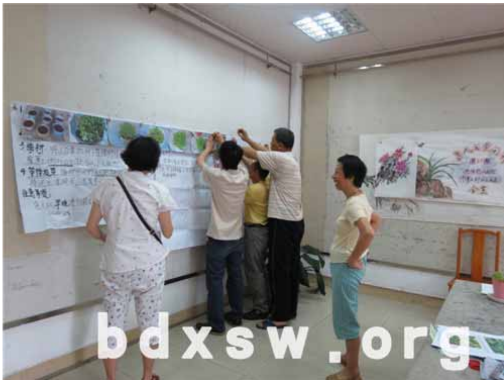
组员为白菜生长图片排序并挂起来

结束后，组员们都反映通过这次小组，他们学会了种植小白菜以及护理白菜盆栽的一些小常识，外出黄埔公园踏青也让他们认识了很多的植物，觉得很开心，希望以后还可以参加这样的小组。