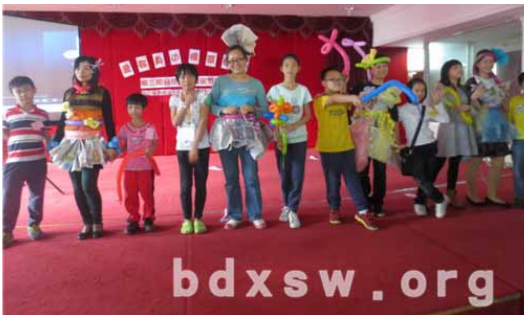
妈妈的新衣

大家都表示这次活动内容丰富精彩，这次的活动用青少年的活力去感染长者，用青少年的力量将长者、残康、中青年家长串联了起来，串联了爱。