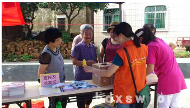
数名长者开心地参与拼图和摸水果的游戏。

本次活动至11点30分结束。根据众多长者的活动反馈，社工了解到此类活动的形式丰富多样，迎合到长者的实际需要，有助于长者增强夏季疾病防范意识，促进社工与社区居民的互动，日后将开展更多此类的社区活动，回应和满足居民的需求。