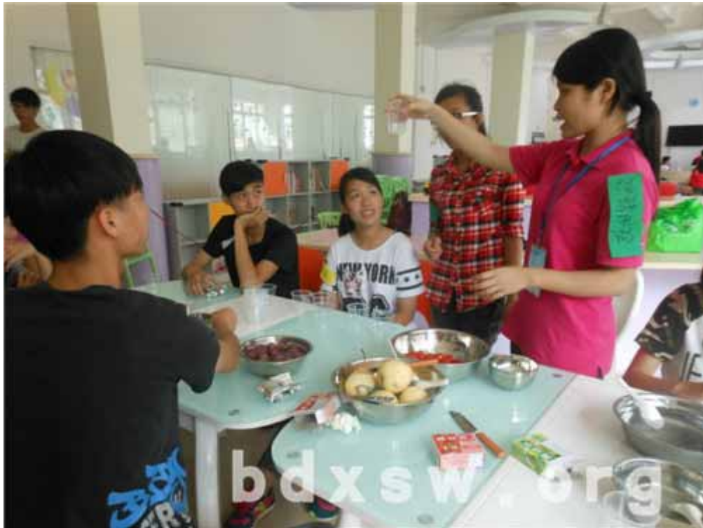
社工正在示范啫喱的做法

在同学们的欢声笑语声中，本次活动圆满落幕！均安社会综合服务中心希望有更多的青少年朋友们加入到我们这个大家庭中。