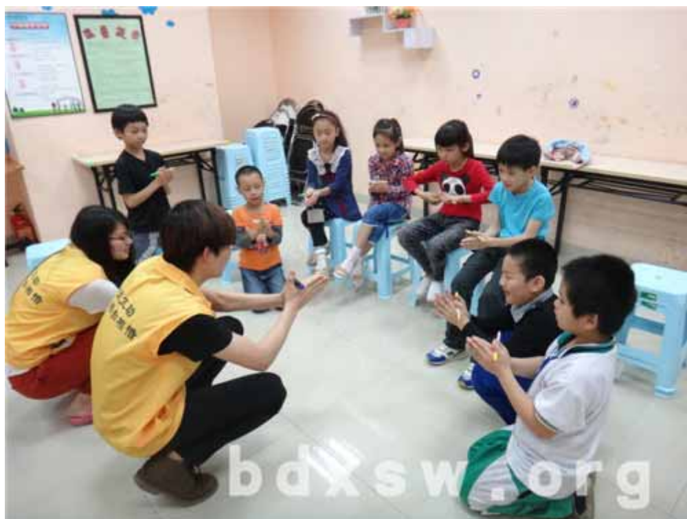
一起练练手指操

本次魔术兴趣小组的活动一共有13位8到10岁的小朋友参加,活动旨在通过学习魔术的形式,协助组员开阔视野;并且通过学习、表演小魔术让组员体验魔术表演带来的成功喜悦以增强组员对魔术的兴趣。