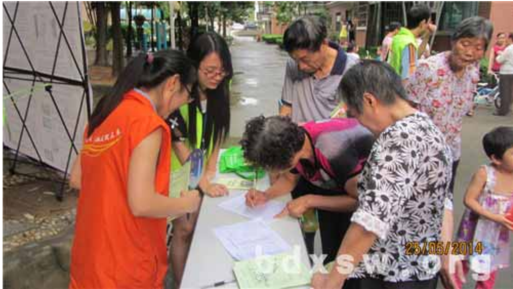
爱老行动齐参与环节

本网讯（石李燕）2014年5月24日下午，元岗街家庭综合服务中心在南兴社区组织开展了“爱老从心开始”社区爱老宣传活动，本次活动旨在促进社区居民更好地关爱老年人，促使社区形成爱老、敬老的浓厚氛围。