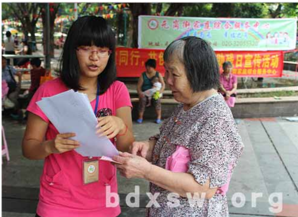
义工向社区居民宣传关爱伤健人士