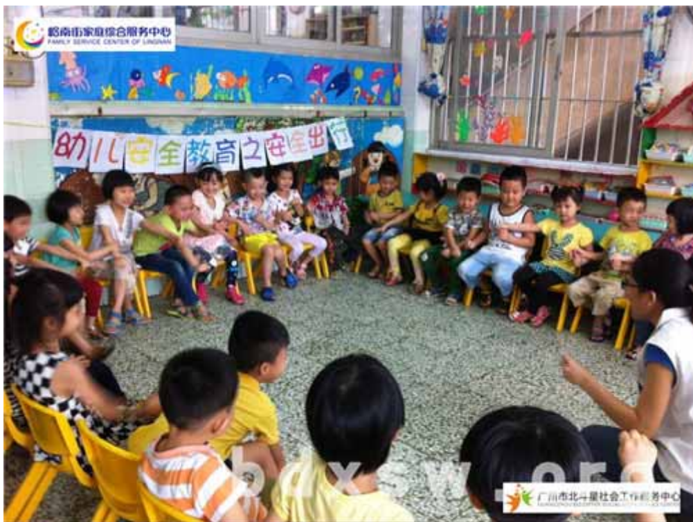
小朋友们正在玩游戏（摄影 刘敏茹）

活动在小朋友们的童言童语中顺利结束，大部分的小朋友们能说出安全出行的注意事项，活动的成效显著。接下来，岭南街家庭综合服务中心将会继续与辖区内的幼儿园合作，推广幼儿园安全教育。