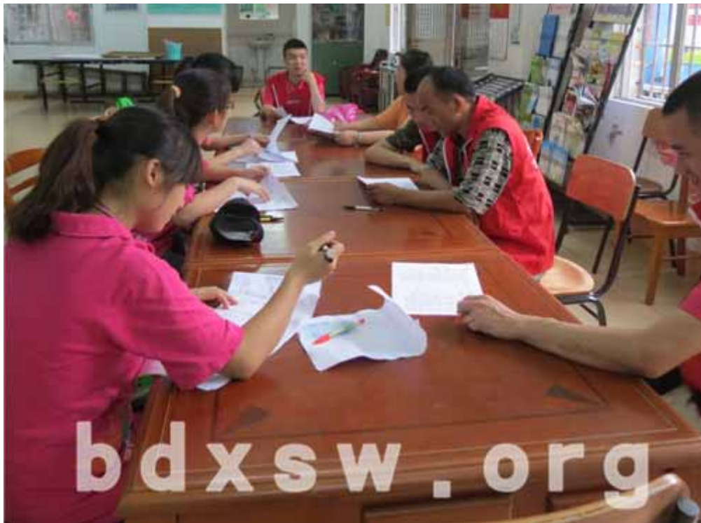
老友义工在培训

互动交流；促进伤健人士义工（下称“老友义工”）和社区居民的互动交流，展现老友义工的风采，促进两者的共融。