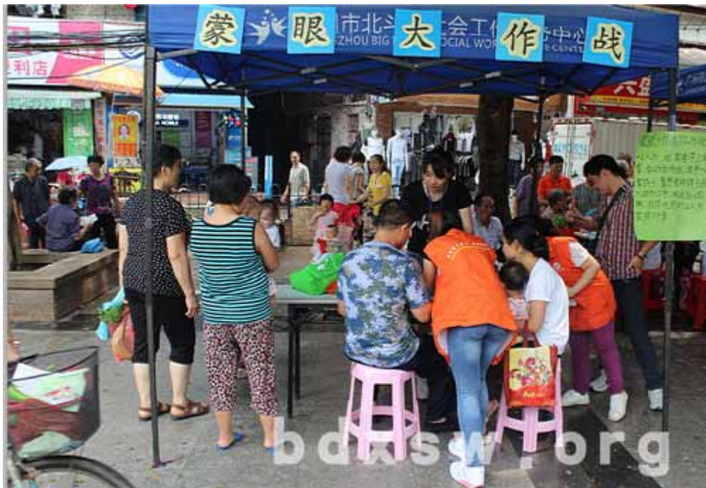
社区居民体验视障游戏

活动以摊位的形式开展，共分成三种摊位，分别是宣传与问答、微电影分享及游戏体验。在宣传与问答摊位中，居民可以了解到一些关于伤健人士的知识，如常见的情绪病，处理负面情绪的方法等。通过微电影的分享，让居民感受到伤健人士也在非常努力地生活，同时看到了他们发挥的潜能。在游戏摊位中，居民除了玩得非常开心之外，也可以真实地体会到伤健人士日常生活中的不便，使得居民更加明白和体谅伤健人士。