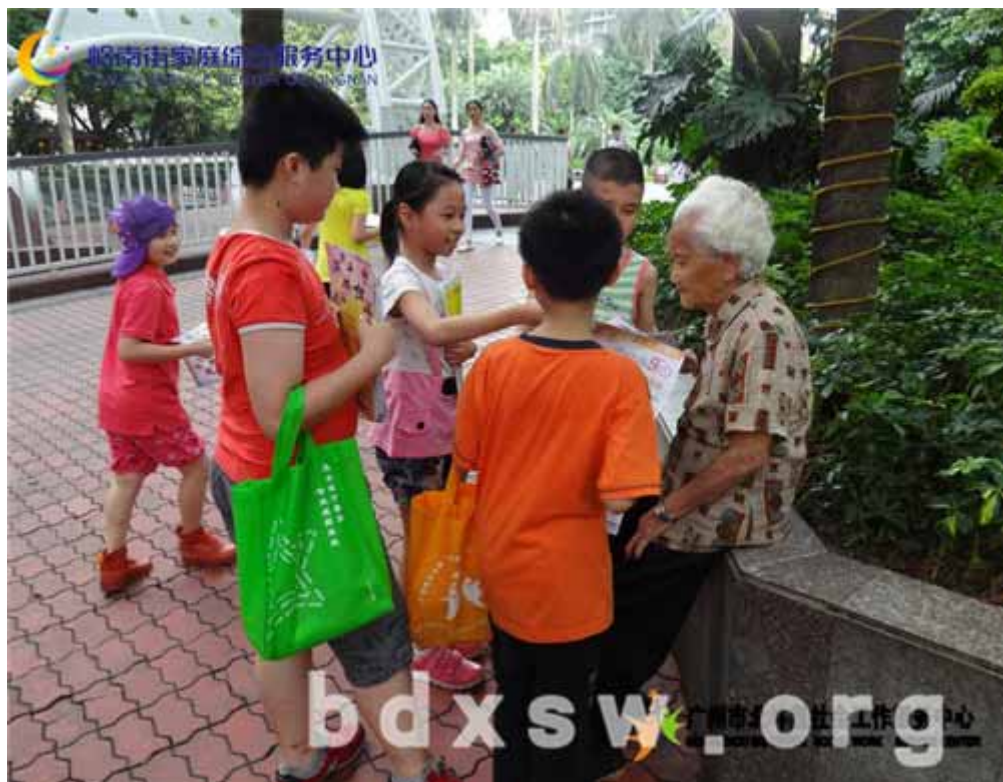
青少年义工向居民派发宣传刊物

在活动分享环节，有青少年义工表示经过第一期活动的经验，这次能够更加勇敢、更加好地向居民宣传。青少年义工在向居民进行介绍的时候，很有礼貌、很谦卑，十分值得大家学习。社工肯定青少年义工的工作，邀约其继续参与日后的活动，青少年亦踊跃报名参加。