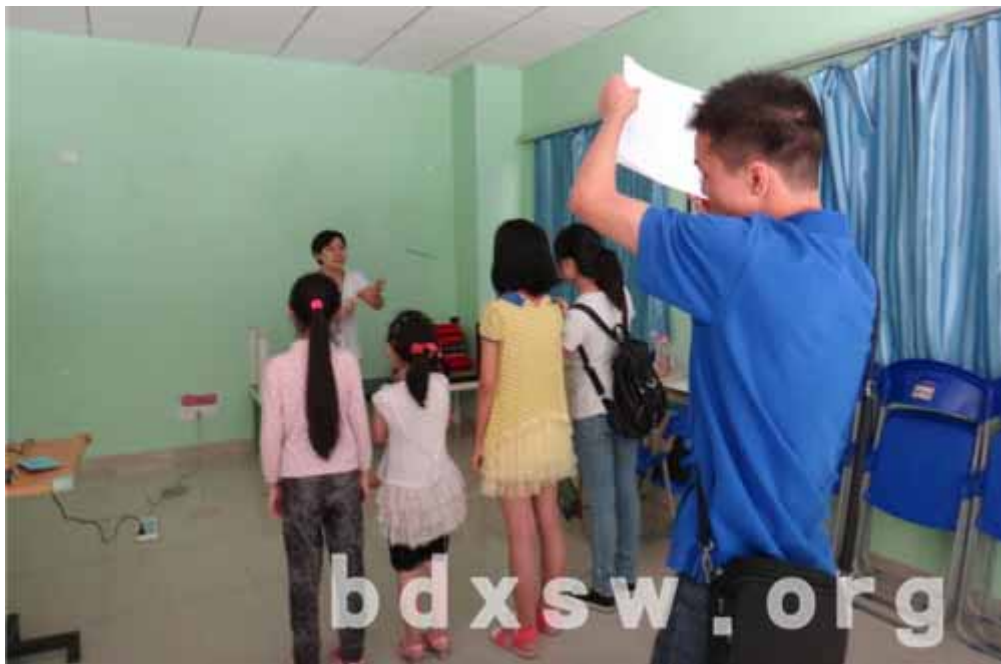
社工义工——你比我猜

本网讯（宁晓敏）2014 年 5 月 17 日上午，天园家综传来一阵阵欢快的笑声。现场，你也会看到有几个大人们和一群小朋友在中心场内走来走去，并且有的举着相机，不断拍照。他们是在干什么？原来是天园家综开展 5 月的义工聚会。本次聚会主要是让义工零距离接触中心社工，以及认识中心场地。