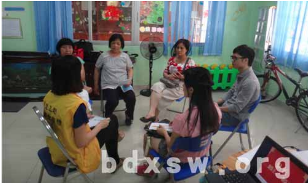
美食每刻义工队员与社工一起交流

本网讯（彭咏蓓）5月18日上午十时至十二点美食每刻义工队成员在天园家综的膳养乐园参加了“义起美食交流会”活动。本次活动旨在通过美食每刻义工队队员之间的游戏互动，拉近队员之间的彼此的关系，提高队员参与活动的积极性；通过强化队员的决策权，以达到给队员赋职，能更好地促进美食每刻义工队的发展。