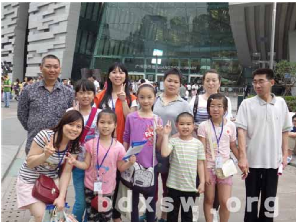
图书馆之旅

此节小组主要环节有办理读书证、学习利用图书馆资源的方法技巧、总结分享、大合照和亲子自由照。主要通过设置亲子喜闻乐见的任务卡形式，让组员掌握获取广州市图书馆资源的方法与途径。过程中，新广州人亲子通过完成任务卡，学会了自主检索所需书籍、期刊和碟片，以及通过人工及自助通道借书、还书等流程，体验了自主利用图书馆及相关服务。在活动中，组员学习热情高涨，积极主动地请教社工和义工，组员之间也互帮互助。如其中一位低年级的小朋友经过其他组员帮助借到喜欢的书籍。还有一位组员表示：“我学会了在人工通道借书和还书，以后可以自己来了”。组员借助小组不仅学会了利用图书馆社会资源，还增进了彼此沟通、结成了朋友。总体上，组员在良好的气氛中体验亲子阅读，留下了美好的互动时光。