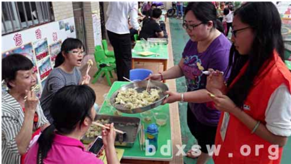
大家分享着美味的云吞

本网讯（黄嘉琦）五四青年节，如何过得更有意义？5月4日下午，伦敦社区营造项目联合仕版村委以及天伦万家群益中心，在仕版幼儿园举行了五四青年节“包出送关爱活动，活动吸引了许多青年和义工参与活动。