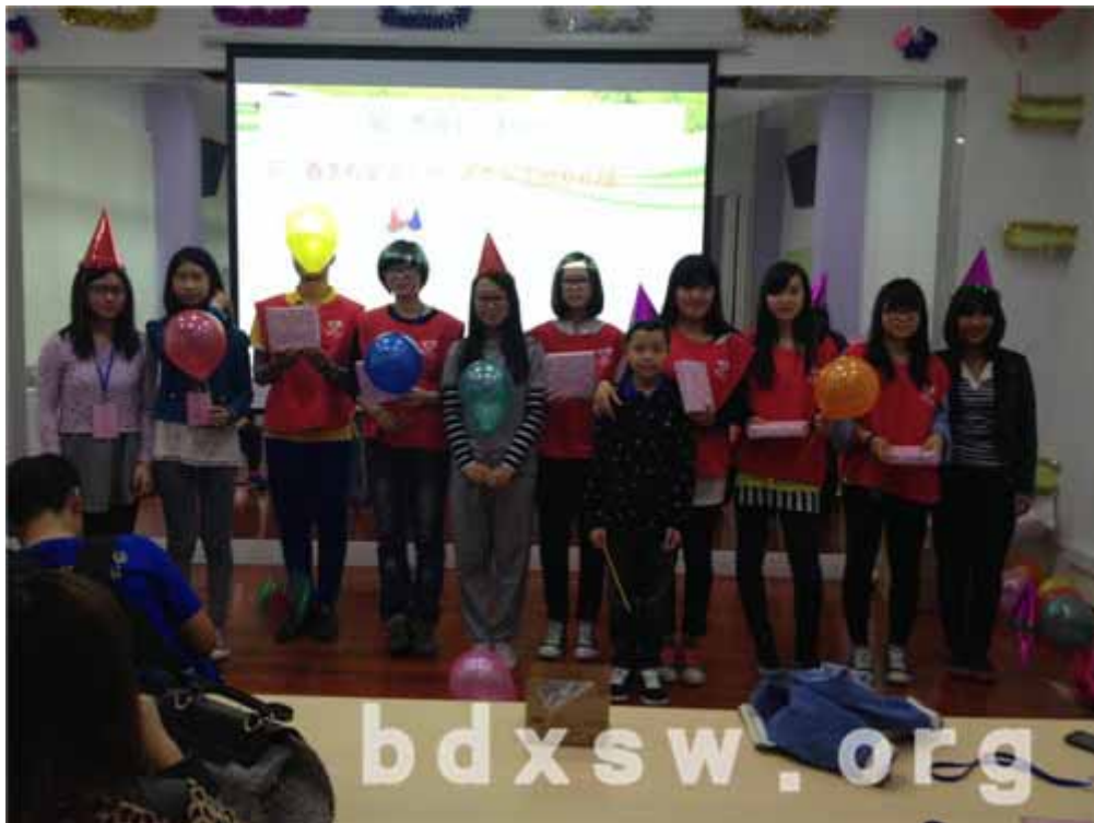
寿星们为受表彰义工颁奖

本网讯（欧阳焕结）2014年3月30日上午，均安社综义工领域在三楼梦之坊开展义工春季生日会暨第一季度义工表彰活动，在春季生日和1-3月提供过志愿服务的18位义工参加本次活动，并由寿星们为受表彰义工颁奖。