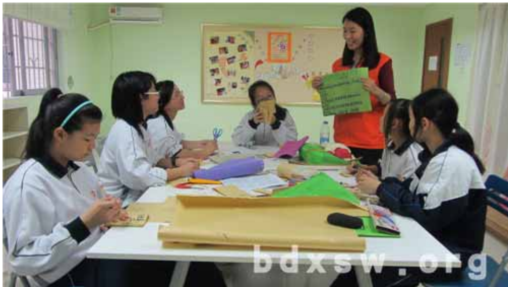
组员认真倾听社工分享青春历程

本网讯（王玉林）2014年3月28日下午，持续1个多月的“可爱青春”保卫战之青少年身心自我认识提升小组在元岗街家庭综合服务中心的乐融园圆满结束啦！小组面向元岗辖区6位初一女生开展，通过提供组员一个认识青春期女生生理、心理变化的交流平台，以此协助青少年客观认识青春期身、心变化，并提升青少年对青春期女性身、心问题预防方法的认识。