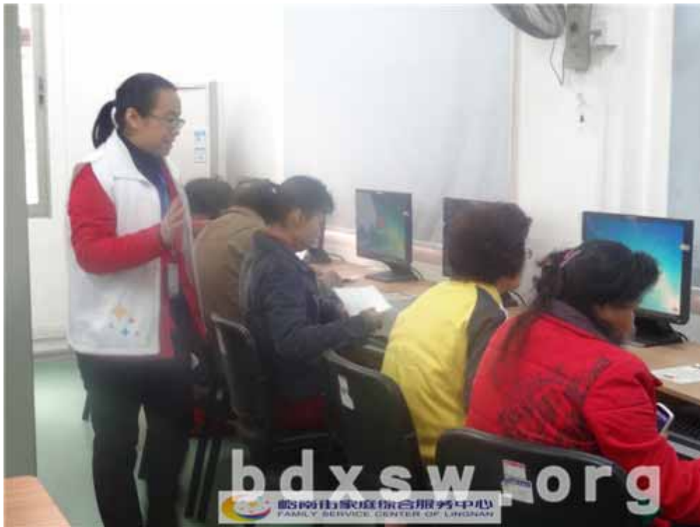
社工指导组员完成小组练习内容

小组结束后，组员们都表示小组实用性非常强，希望日后能够继续参与中心开展的网络科技相关的小组活动。