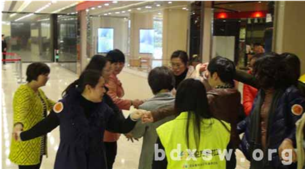
女士们投入游戏中

本网讯（雪儿）3月5日下午，为迎接“三八”妇女节，促进伦敦各企业的认识和交流，天伦万家群益中心携手伦敦总工会在伦敦周大福展馆开展了“珠光熠熠，乐在大福”女工干部交流活动，共有70位企业女工委参加。