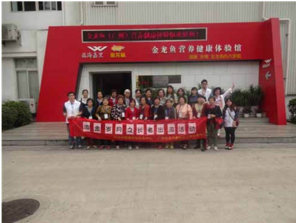
社工与长者的大合照

在接下来的日子里岭南家综将会因应长者的需求开展服务，丰富长者的晚年生活，让闲暇时间过得更有意义。