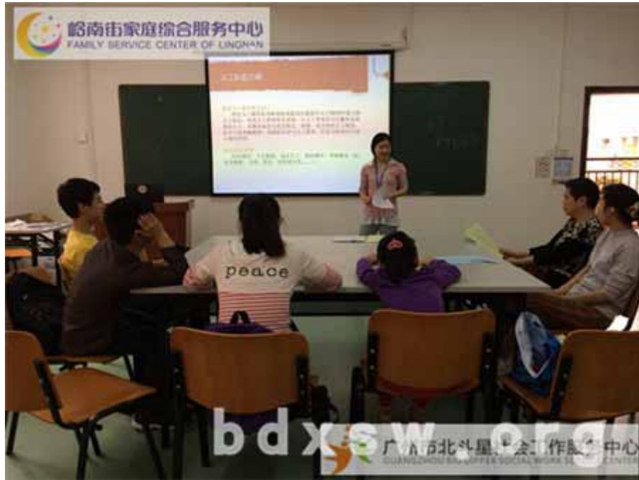
义工自我介绍（摄影 方秋婷）

在创新、精彩的照片展示环节，义工对中心人员照片、真人义工装备展示照片及往期义工风采照片，表现出了更大的兴趣。他们兴致勃勃的浏览照片，积极提问，并在照片问答环节表现踊跃。