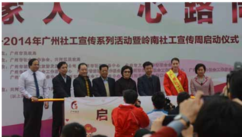
广州市副市长贡儿珍等领导启动岭南社工宣传周活动

本网讯（薛钧文）3月22日，2014年广州社工宣传周系列活动暨岭南社工宣传周活动启动仪式在广州花城广场举行。广州市副市长贡儿珍，省民政厅、市民政局、市社工委等单位相关负责人参与了启动仪式。北斗星社会工作服务中心作为协办单位参与了本次活动。