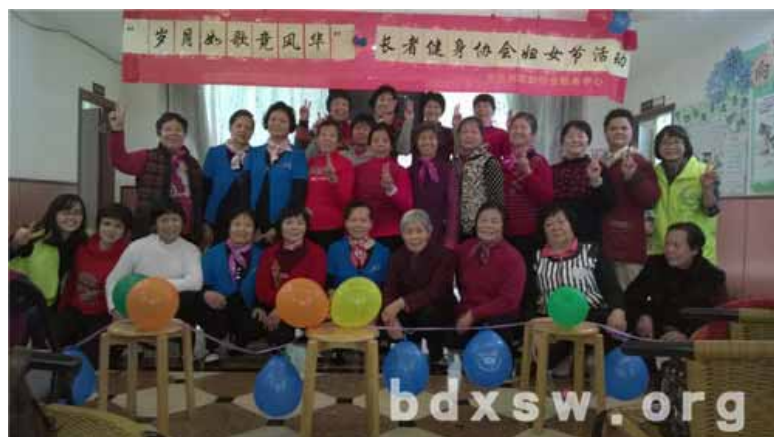
长者健身协会大合照

本次活动全程由长者健身协会的核心成员主导，尽管这只是协会组织内部成员开展的一种自娱自乐表演活动，但在社工的协助下节目形式也丰富多彩，包括了广场舞、民族舞、扇舞以及双人舞，过程中还加入了社工与协会成员们的合唱互动形式等等。最难能可贵的是本次活动的两位主持人均由协会成员担任。由于主持人年纪颇长，加上是第一次担任主持，过程中也偶尔出现了忘记主持稿内容的小瑕疵，但借这个活动平台为她们提供了锻炼的机会，提升了他们的自信心，也为培养其逐渐迈向正式式的主持行列奠定了基础。