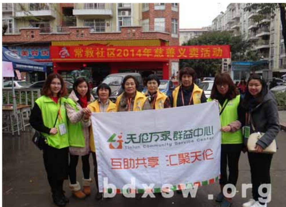
工作人员的大合照

长者义工们表示对今天的成绩很满意，并对本次的经历感到很开心。而宣传方面，中心社工对过往的居民派发单张宣传雷锋月便民服务，有居民现场报名参加活动。也有不少经过熟悉天伦万家的居民来支持中心义卖和咨询三月份服务，非常给力。