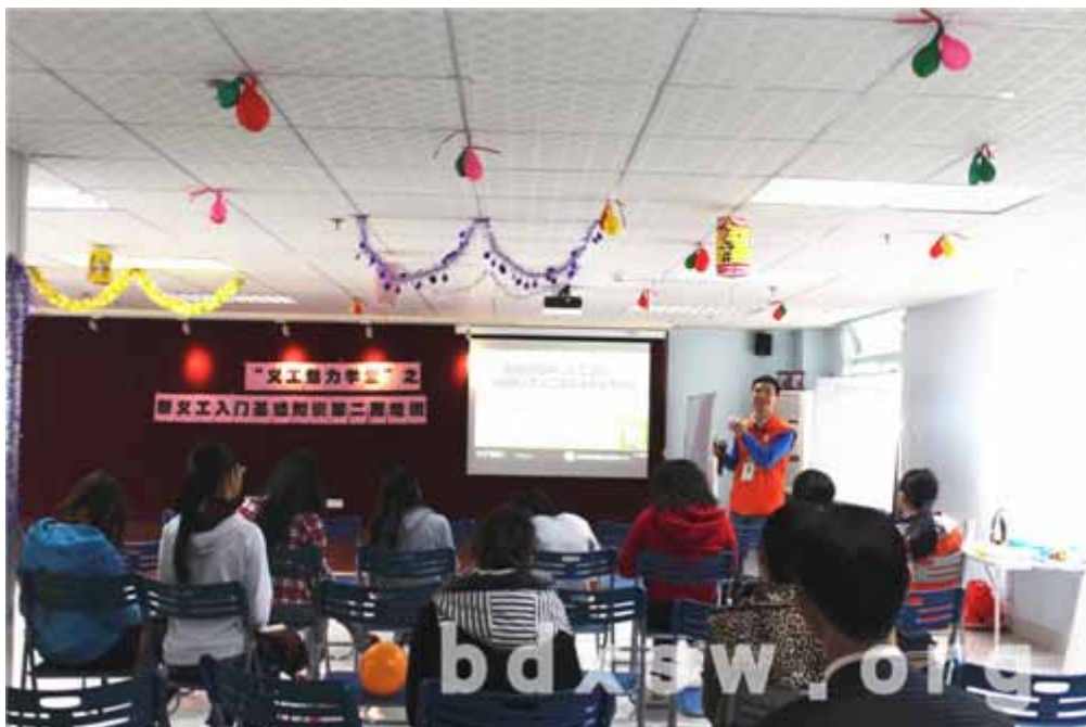
义工基础知识培训中

元岗街家庭综合服务中心社工于 2014 年 3 月 22 日上午开展第二期 “义工魅力学堂” 之新义工入门基础知识培训，该培训主要面向未参与义工服务及未参与义工基础培训的义工。旨在通过培训提高义工们对于“义工服务”基础概念的认识，进一步明确自己做义工的期望，为社工与义工进行互动交流提供了平台。本次培训吸引了 16 名义工学员参与，其中 14 名义工学员为本地居民义工。