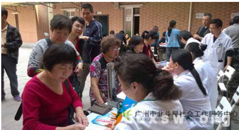
长者排队进行健康咨询

本网讯（黄旭）为弘扬尊老、爱老的传统美德，营造和谐的社区氛围，岭南街 2014 年 3 月 25 日组织辖区内社区医院保健预防部的专业医疗团队及广州市老干大学经络协会的资深学员在岭南街家庭综合服务中心为居民开展社区义诊服务。本次活动共有超过 100 名长者接受包括按摩、手诊、量血压在内的义诊项目。