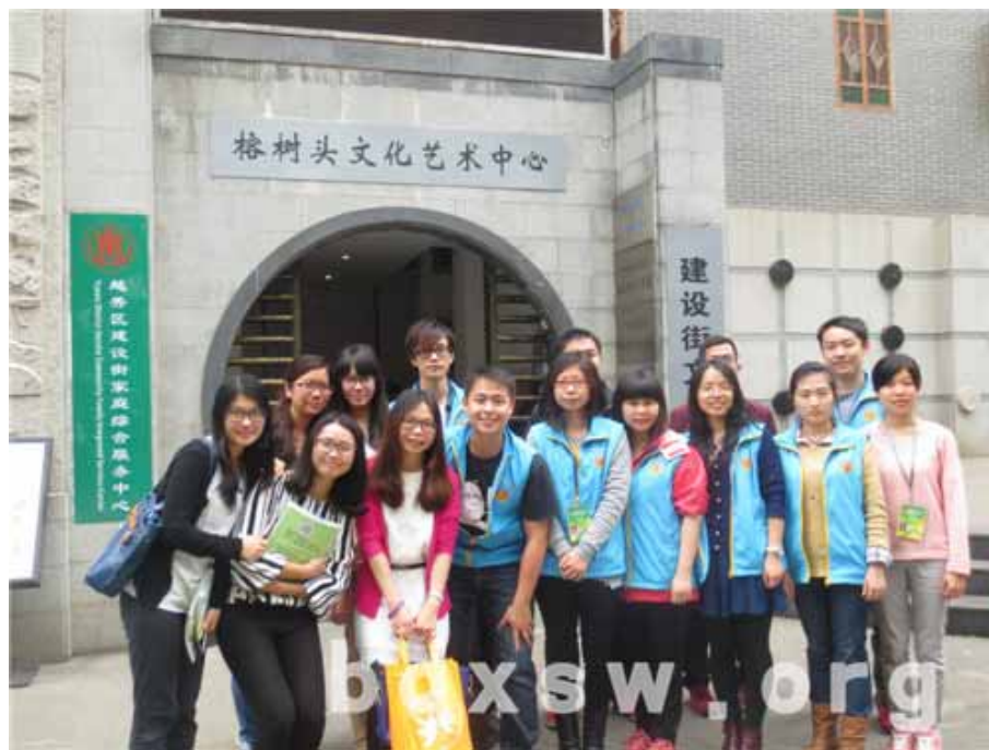
白云街家综交流小组与建设街家综社工合照

此次参观交流让白云街的参观学习交流小组获益良多，并与建设街家综主任约定有机会到白云街家庭综合服务中心再做交流。