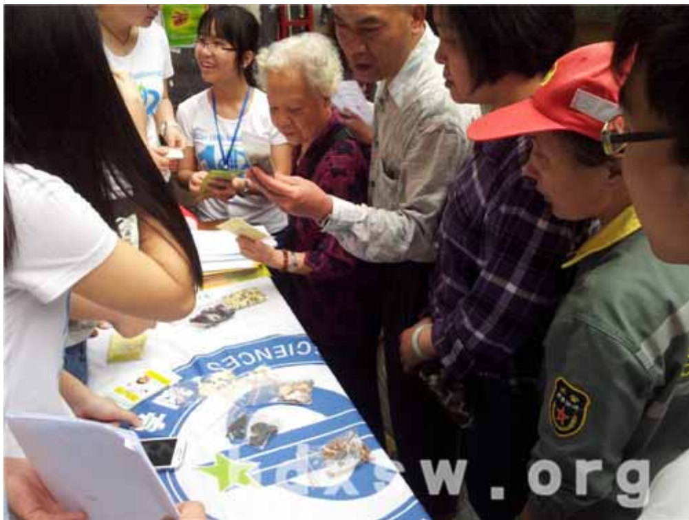
参与居民进行中药辨识

本网讯(黄斯惠)2014年3月29日上午9:30-11:00，白云街社区安全合理用药进社区活动在筑南大街如火如荼举行，尽管活动当天天气欠佳，但在家综社工与中大药学院一众学生的群策群力下活动仍能取得圆满成功。