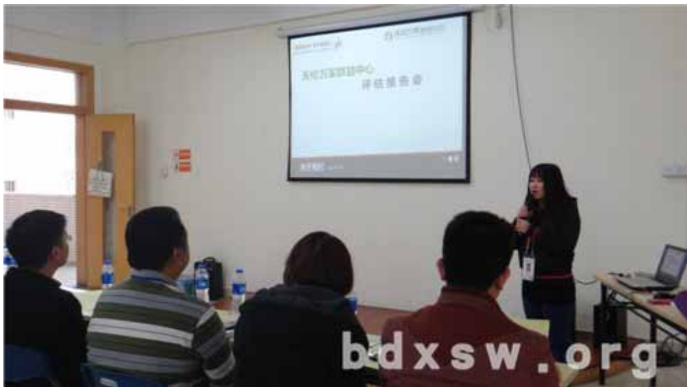
中心主任回顾过去一年服务情况

评估报告会顺利结束，中心发展不会停步。中心全体将会以本次评估会中得到的肯定与期望为前进的动力与基石，进一步推动“互助共享，汇聚天伦”的服务理念的实现！