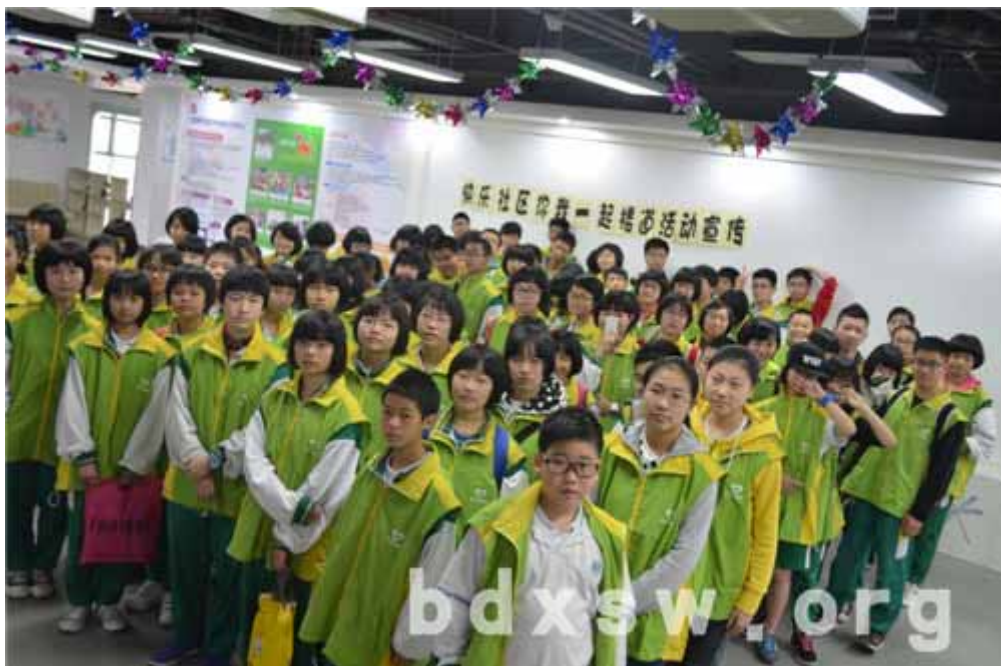
楼道宣传活动义工大合照

本网讯（李康燕）每年3-5月份的春季，乍暖还寒，是人情绪较差及不稳定的季节。随着生活水平的提高，加之现代人承受的压力越来越大，人们对影响心理变化的因素也越来越敏感，而季节对人心理情绪的影响愈加明显。值此月份来临，3月1日东澍街家综特意组织了95名青少年义工到社区上门进行情绪健康扫楼宣传活动，派发中心活动预告和情绪健康宣传单张，