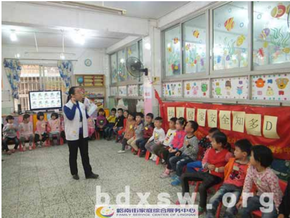
社工向参与的小朋友讲解游戏规则

本网讯（刘敏茹）2014年03月20日上午9点30分，荔湾区岭南街家庭综合服务中心在光扬幼儿园举行的“ 幼儿居家安全知多 D ” 活动顺利开展。为了提高幼儿主动学习居家安全知识的兴趣，加强他们的居家安全意识，岭南街家庭综合服务中心家庭部与光扬幼儿园合作开展了幼儿居家安全知多 D 活动。本次一共有 43 名的 5 岁小朋友参与活动。活动是利用游戏、图片及视频展示的方式与小朋友进行互动，希望小朋友能够通过各互动环节的意识到家胡乱触碰热水壶、煤气炉、电器等这些容易烫伤或酿成火灾的物品是非常危险的行为，进一步提高他们的居家安全防范意识。