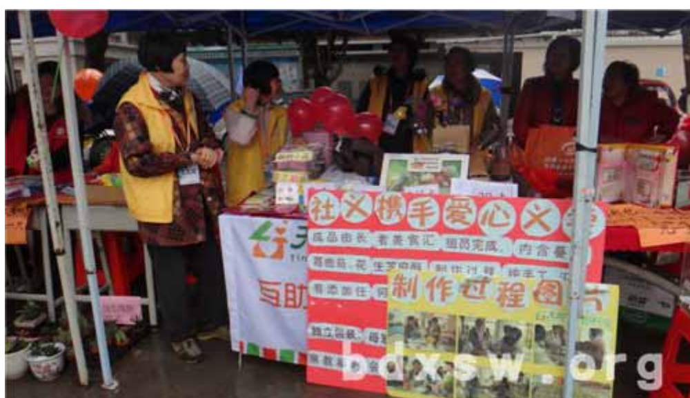
下雨天义工也准时到岗，摆好摊