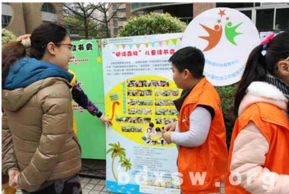
读书会小义工在给居民做介绍

2014年3月22日，天园街家庭综合服务中心的“阅读森林”儿童读书会已是成立了一周年！在这一年间，“阅读森林”儿童读书会在社工的带领下，开展了丰富多样的系列读书活动，受到众多家长和孩子的喜欢。