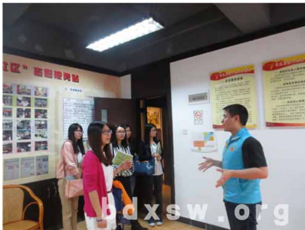
建设街家综社工向白云街家综交流小组介绍场室