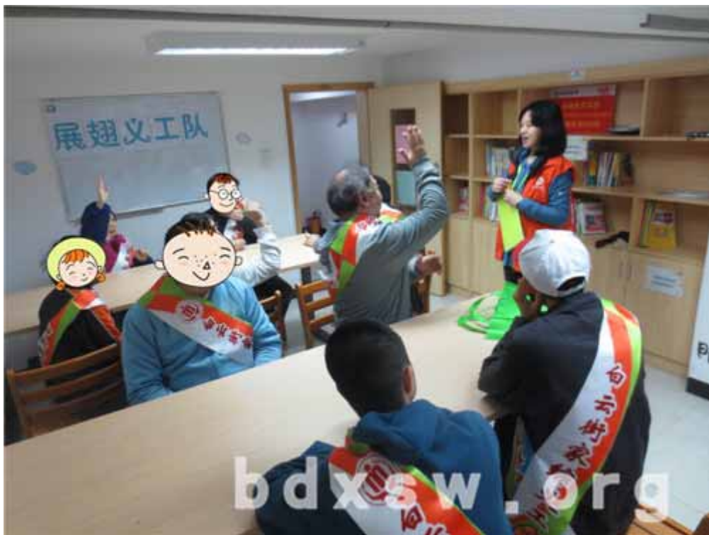
大家积极为义工队的发展出谋划策

趁着雷锋月这个时机，社工联系康园工疗站，筛选了一部分能力相对较好的残康人士，为白云街助学超市提供场室清洁服务。通过本次活动，一方面，可以让学员在实践中体验做义工服务的意义，另一方面，成立白云街展翅义工队，并组织队员商讨义工队的发展。