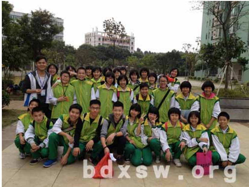
社工与参加活动的青少年义工合影

本网讯(吴杰臻)雷锋月正式到来,新时代的雷锋精神被注入新的内涵,发扬雷锋精神不仅是个人的事,还是全社区、全社会的事。3月1日上午10时,东漖街家庭综合服务中心组织了社区内30名青少年义工,开展了一场名为“我是雷锋”的青少年社区策划活动。活动形式以传统的社区清洁为基础,融入了社区调研、成果汇报、主题讨论和方案策划等新元素,让青少年从更加宏观的层面和角度,去为解决社区环境卫生问题尽一份力量。