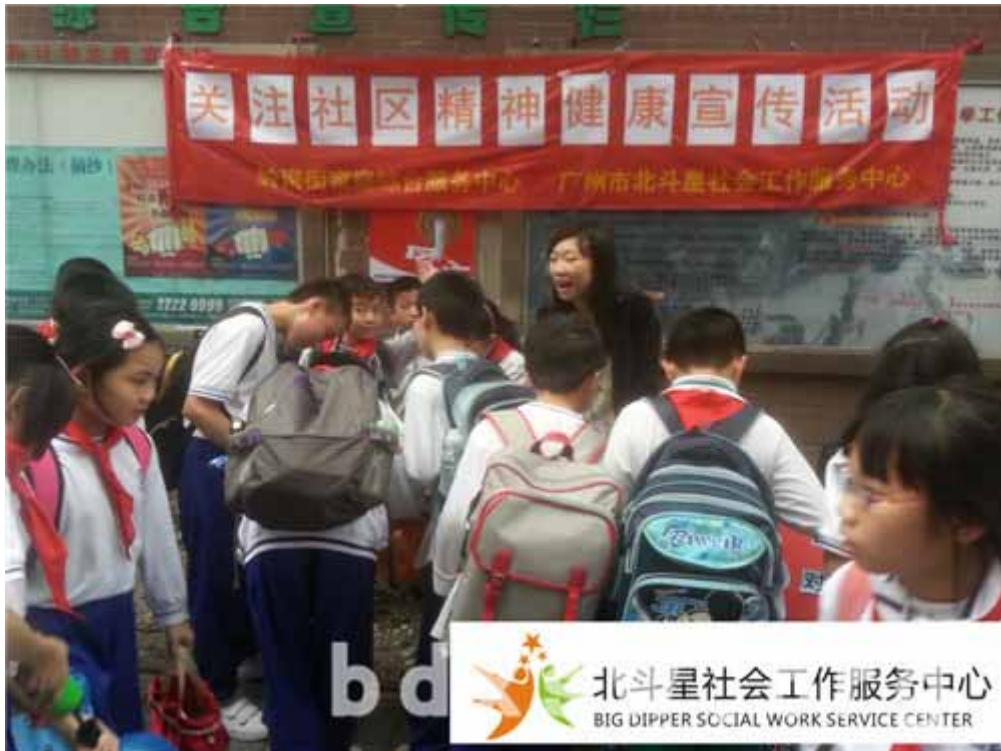
游戏吸引众多学生参与

是吸引了众多放学的小学生及陪同的家长参与，在社工的引导下，同学和家长们既能了解到如何释放精神压力的方式，又能获得中心送出的小礼品。