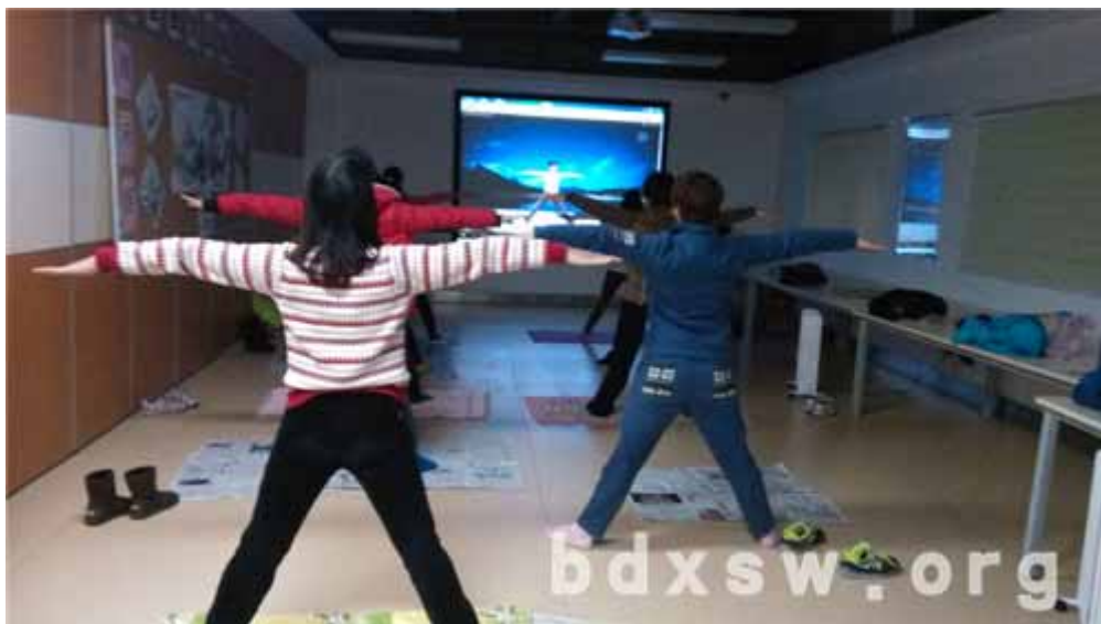
工作人员与组员们一起做瑜伽

本次小组除了给在职居民提供职场减压平台以外，还能通过发动组员互帮互助，解决小组内部问题，搭建居民之间的关爱网络。