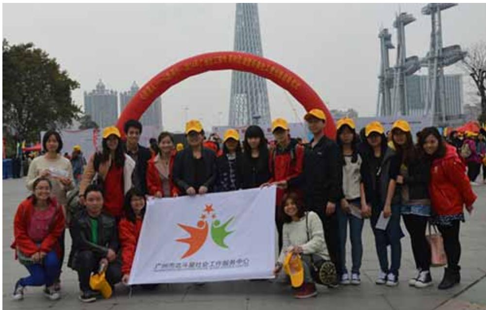
北斗星社工参加活动的工作人员及居民

本次活动，北斗星社会工作服务中心作为筹委会成员，大力支持本次盛会，承担了宣传资料的采集任务。派出工作小组在活动当天协助现场工作。并组织了近 30 名社工和社区居民到活动现场参加“心的家人心路同行”公益步行活动。