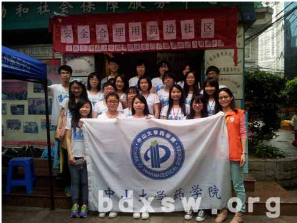
活动结束后中大学生与社工大合照

活动内容包括辨别中药及安全用药知多少的问答游戏摊位，由中山大学的6位学生负责，其余工作人员则在摊位外围进行纸质宣传品派发，包括安全用药手册、社工服务宣传单等。参加的街坊，只要能成功辨识3种中药材并正确回答2道安全用药的问题，则可获赠小礼品两份。在中药辨识环节，许多街坊的辨别能力让一众药学院的学生惊叹，殊不知对于“地道老广”而言，许多中药材都是煲汤的好材料，因此对于很多街坊而言辨别中药材是“拿手好戏”！但关于安全用药问题，则不是大部分街坊都能回答出来，因为问题涉及一些日常居民用药误区，所以有不少街坊也因此而“中招”！活动整体气氛热烈，有一些居民还拉自己的邻居过来参加活动。