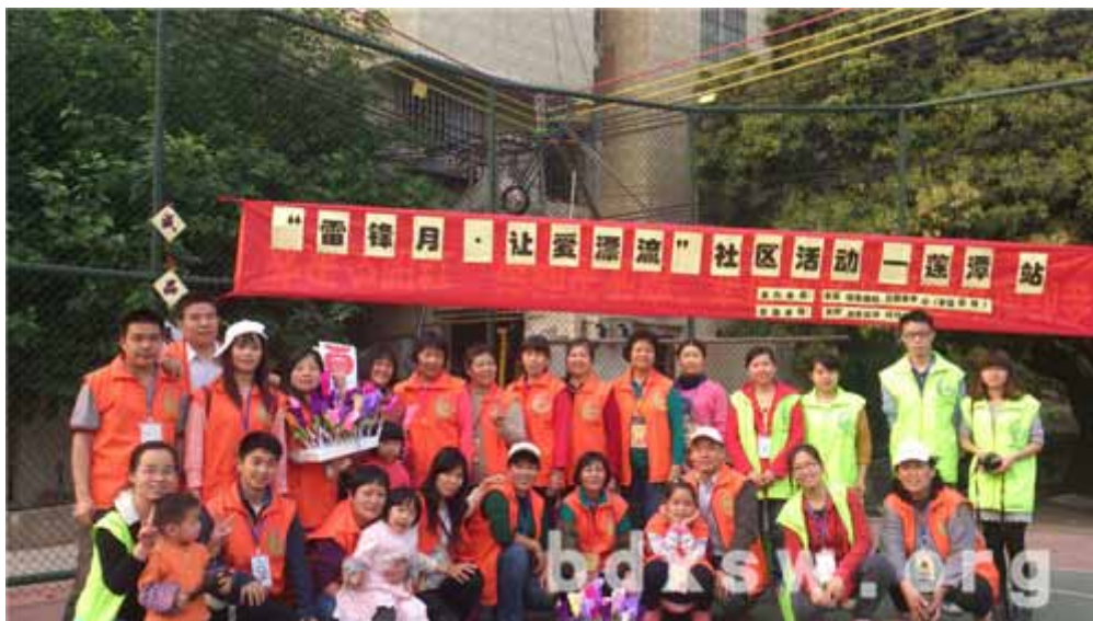
义工社工大合照

获得“幸福街坊·爱的传递者”称号及换取“爱心漂流礼物”一份，同时在社区中展出亲手制作的手工成品。