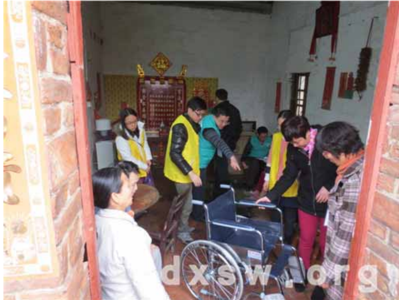
政府为何锦有送上新轮椅

结束之后，社工分别将各自的工作联系方式留给兄妹二人，并将天伦万家的义工服务、家庭服务等服务信息资料留下，告知他们有兴趣和有需要时可以随时联系。