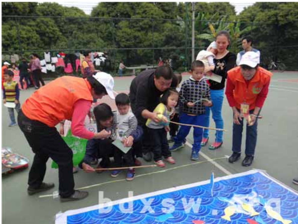
居民亲子家庭齐齐参与“钓出新意”钓鱼摊位

本网（杜婉茹）2014年3月22日，东区街家庭综合服务中心（幸福街坊）分别在刘村社区荷村经济社、火村社区莲潭经济社开展了两场主题为“雷锋月·让爱漂流”的社区活动，分别吸引了荷村经济社120人次、莲潭经济社100人次居民积极参与，共约有130名居民获得了“雷锋月·爱的传递者”称号和“爱心漂流礼物”。