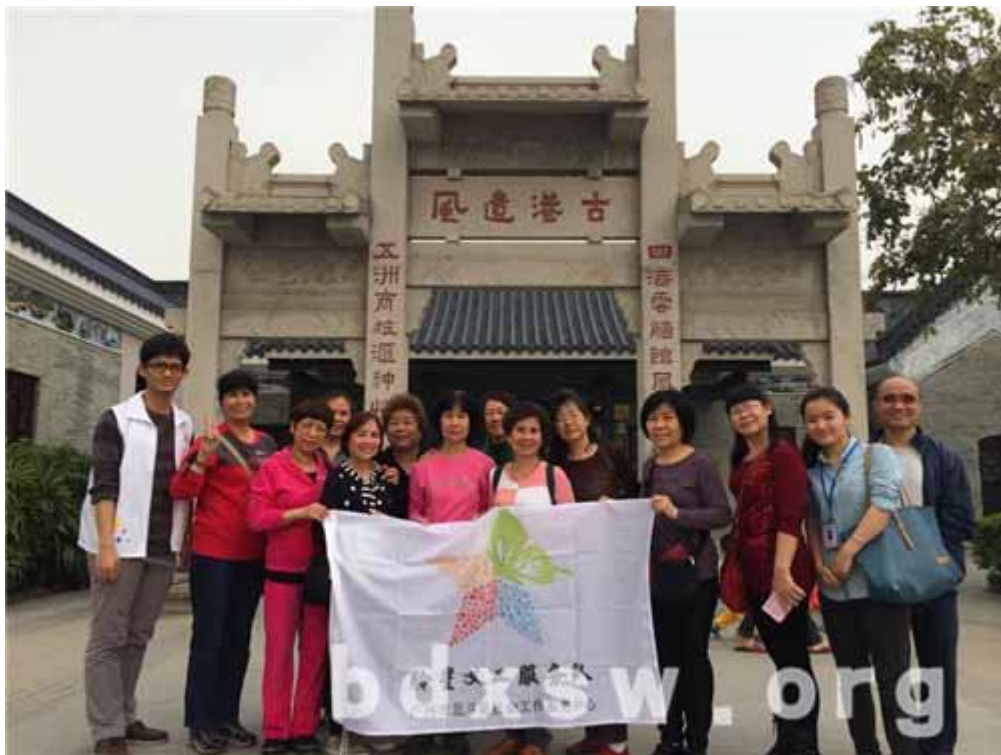
活动大合照

活动从琶洲石基村总站作为出发点,虽然天气不稳定,但是不减义工的出游热情。社工特别邀请熟悉黄埔古村的义工作为“导游”,带领在场的所有人游览古村,先后参观了黄埔古村历史文化景区、古港遗风、黄埔古村博物馆,了解当地的风土人情。在场的义工都感叹黄埔古村的巨大变化,希望日后还有机会能够前往黄埔古村游览。本次活动的另一个环节是义工庆生仪式。大家为第一季度生日的义工庆祝生日,并送上精心准备的贺卡与真诚的祝福。环节结束后,社工与所有义工一起共同品尝了当地的特色小吃——姜撞奶、艇仔粥。