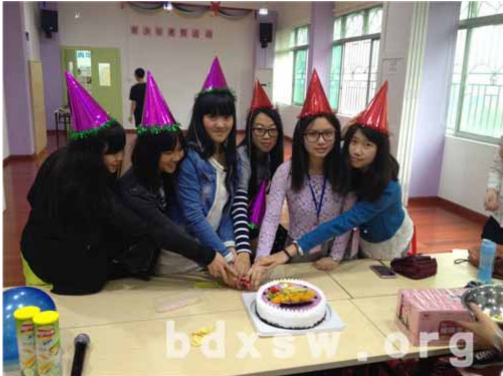
寿星义工一起切生日蛋糕

最后，寿星们在分享可以公开的生日愿望后，在众人的生日歌声和祝福中切开生日蛋糕，大家一边品尝美食，一边欢快地聊天，为本次活动画上完满的句号。