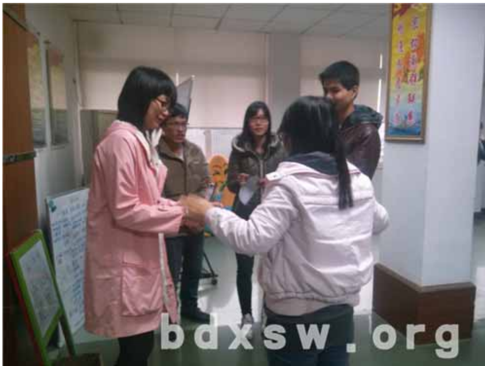
场景模拟

义工在本次培训后获益良多，了解白云街长者的实际情况以及探访相关的技巧，可提升服务质量，希望通过恒常的义工探访可以让社区中的弱能长者得到照顾，增加长者不同群体人士的沟通，让社区资源可以在长者服务中流动。