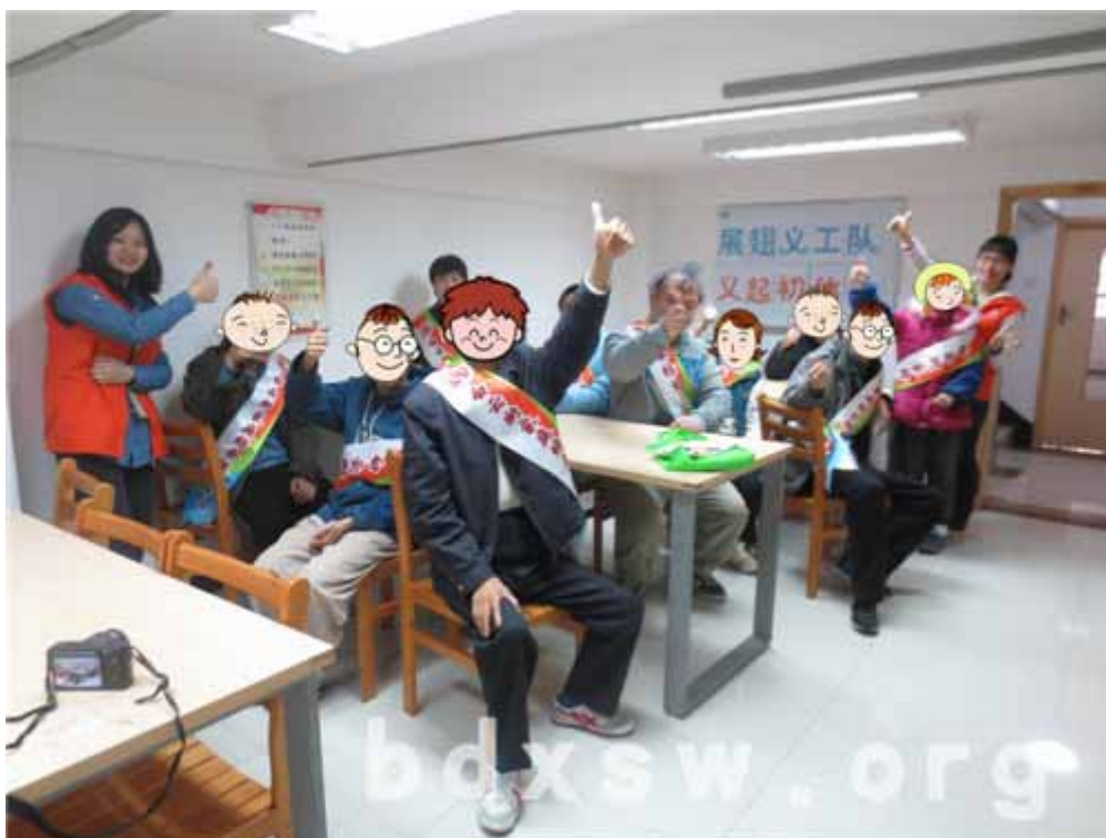
展翅义工队清洁助学超市任务完成

讨，义务清洁、探访孤寡长者这两方面成为近期队伍发展的主要内容。接下来，社工也会根据这两个主要内容，设置一系列的小组活动，对展翅义工队的整体服务能力进行培育及提升。