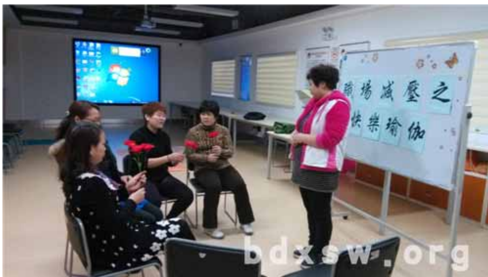
三八妇女节当天组员们收到丝网花玫瑰