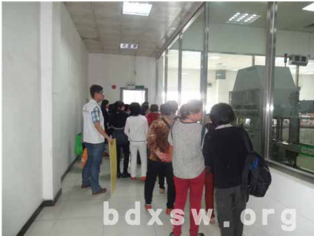
长者边走边看食用油的加工和包装过程

本网讯(方秋婷)2014年3月26日岭南街家庭综合服务中心为辖区内的长者开展了一次游“金”岁月之益海嘉里营养体验馆出游活动。本次活动希望能开阔长者的视野,透过长者亲自到食用油生产基地进行参观,更直观地了解关于油脂的相关知识,加深长者对这方面的认识,以此提高长者对健康饮食方面的知识。