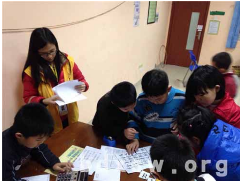
组员在讨论小组名字

本网讯（何雯静）2014年3月16日下午3点30分，天园街家庭综合服务中心社工带领10至12岁青少年开展“青少年智趣体验营 之密室任务”活动。真人密室逃脱是近年来在青少年中非常流行的游戏活动，源自于网络在线解密游戏的场景剧情，游戏参与者会置身于一个封闭的密室内，在被限制的时间里，通过隐藏的线索寻出解脱的方法。社工开展本活动主要是为社区青少年提供互相认识的机会，更重要的是让他们共同合作完成任务，解决问题。